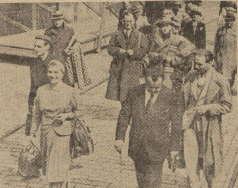
Sefirle birlikte gelen İtalyan tebaasından bir grup

İstanbul, 29 (A.A.) — İtalyanın Tahran büyük elçisi ve elçilik erkânıyla İrandaki İtalyan tebaasından 470 kişilik bir kafilâ bu sabah Erzurum-