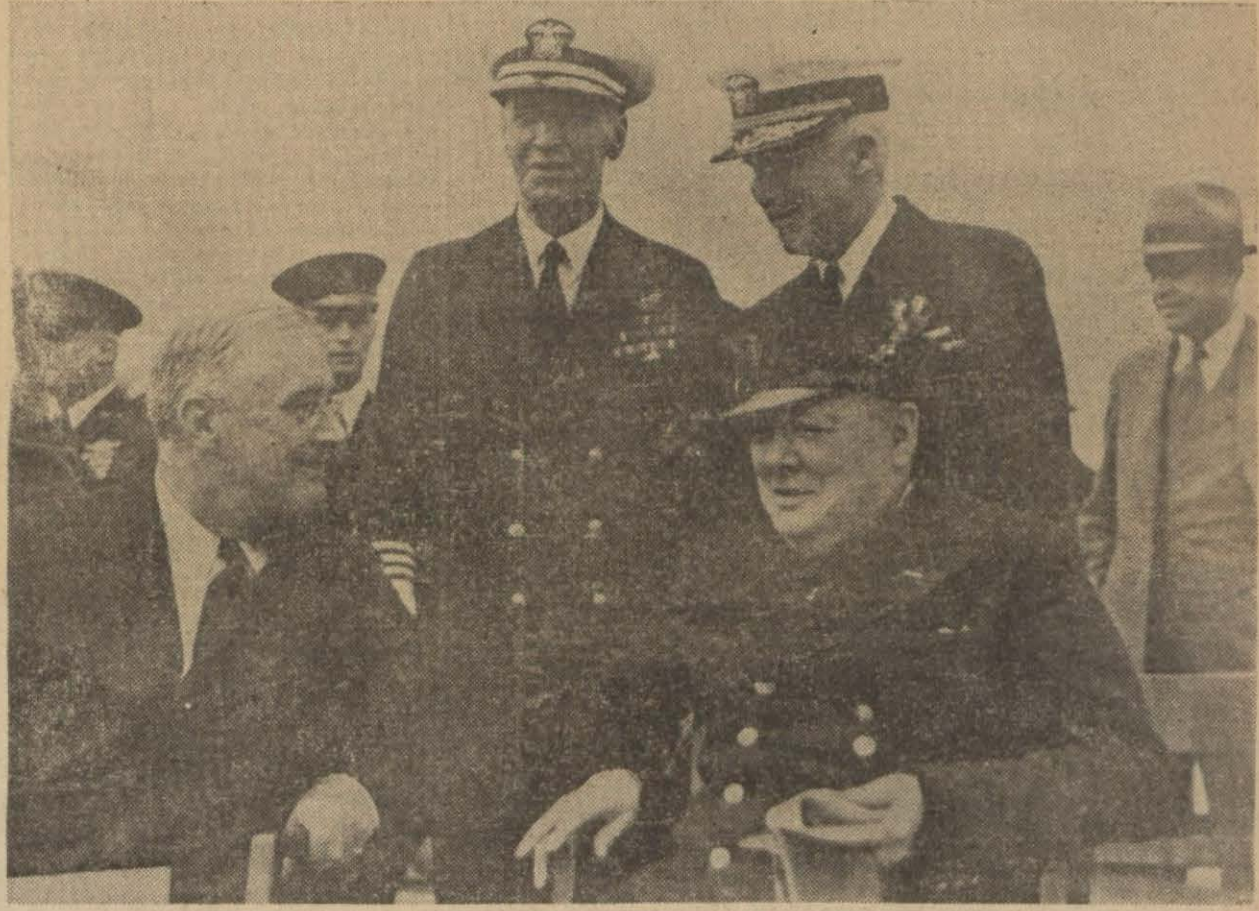
Roosevelt ve Churchill Atlantik deklarasyonunu hazırlamak üzere buluştukları esnad.

Son araştırmaların neticelerine göre, Babchick'in, çetenin kendi ihanetlerini meydana çıkarmasından korkan aynı memurlar ve ajanlar tarafından öldürülmüş olduğu sabit olmuştur.