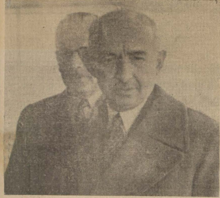
Cümhurreisimiz, evvelki gün Ankara hipodromunda mevsimin ilk at yarışlarını takip ederken

Cümhurreisimiz, Doğumu Yıldönümü Dolayısıyla İngiltere ve Danimarka Krallarının Gönderdikleri Telgraflara Teşekkürle Mukabelede Bulundu