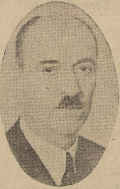
Münakalât Vekili Cevdet Kerim İnce dayı