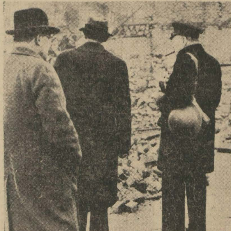
Amerika Cümhurreisi ile buluştuğu haber verilen Mr. Churchill İngilterede bombardmana maruz kalan bir şehri ziyaret ederken

Vaşington, 7 (A.A.) — Halk, Roosevelt ile Churchill arasında mülâkatın vukubulduğunu kanıdır. Umumi kanaate göre, Roosevelt tayyareye binmediğinden bir harp gemisi ile gitmiş, Churchill ise bir tayyare ile gelerek kendisine mülâki olmuştur.