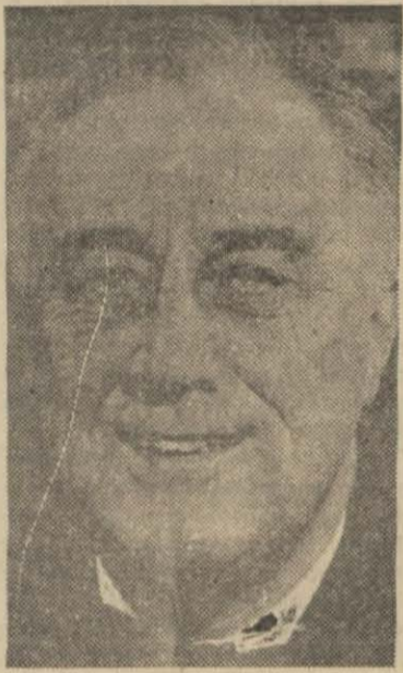
Amerika Cümhurreisi Roosevelt