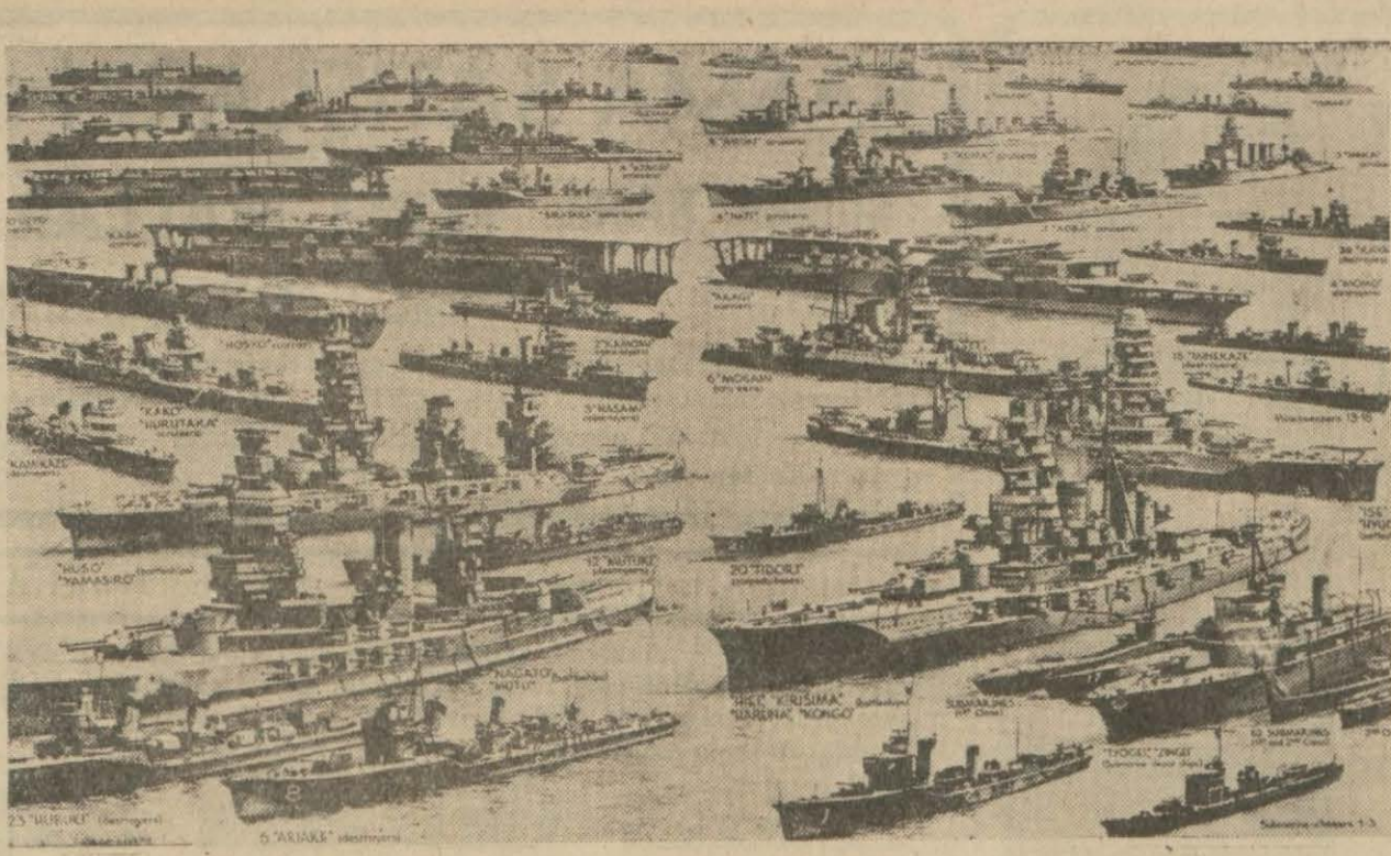
Bugünkü Japon donanmasının toplu bir halde görünüşü