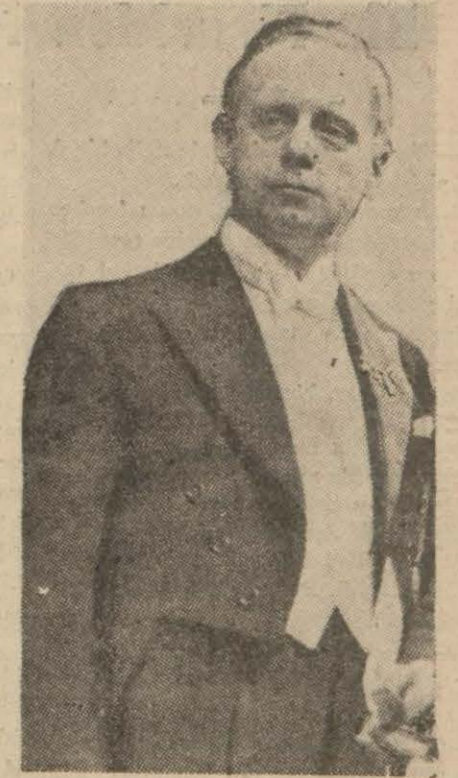
Bir kaç gündenberi Salzburgta Balkan devletleri ricalile görüşen Alman Hariciye Nazırı Von RİBBENTROP.