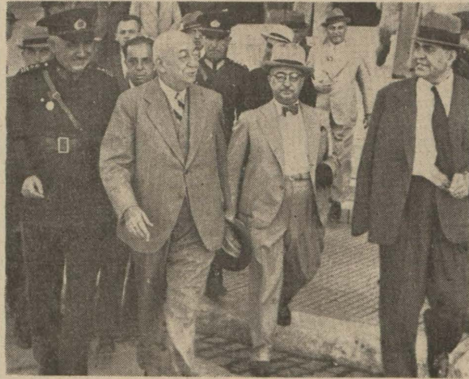
Başvekil Refik Saydam Haydarpaşa İstasyonunda kendisini karşılayanlar arasında