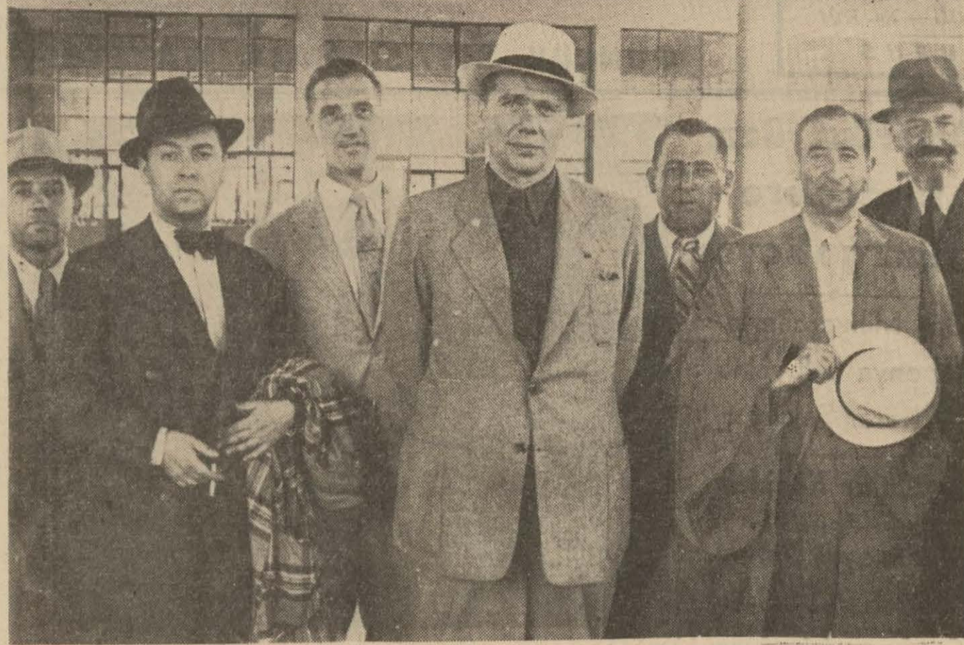
Dün Şehrimize gelen Yugoslav ticaret heyeti