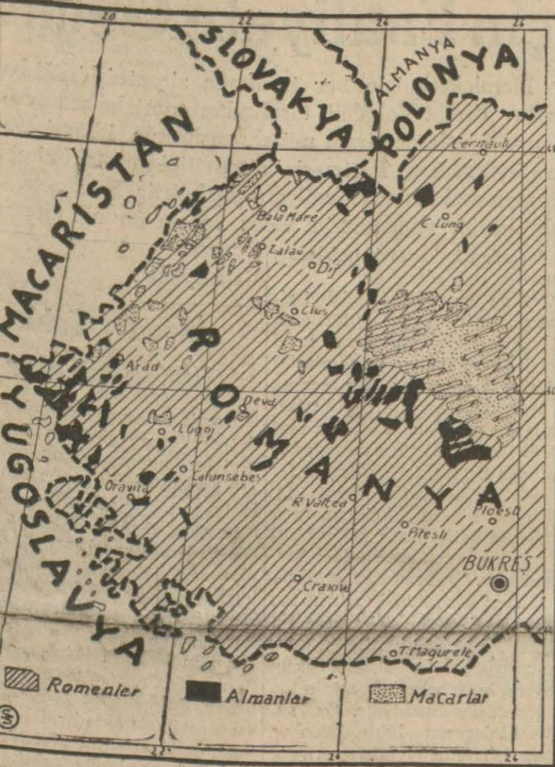
Transilvanyada Macar ve Alman Ekalliyetinin meskûn bulunduğu yerleri gösterir harita

Londra, 10 — İngiltere hükümeti Orkney adaları İzlanda ve İzlanda ile Groenland arası mayinler döktüğünü ve bu yoldan aradaki denizlerin tehlikeli olduğunu ilân etmiştir.