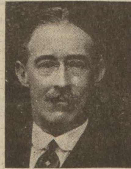
Hindistan Nazırı Lord Zetland

"— Fin - Sovyet harbi esnasında Britanya hükümeti, Fransız hükümetiyle beraber (Sonu; Sa: 6; Sü: 3)