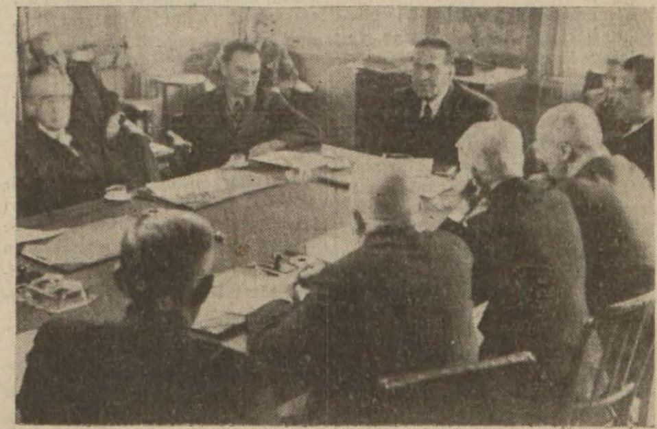
İstanbul Mebusları, dünkü içtimada Valinin izahatını dinliyor. Bu husustaki tafsilât (7) nci sayfamızdadır.