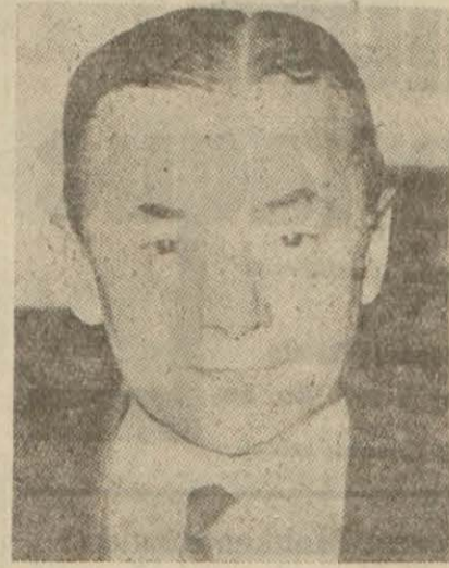
Paris hükûmetinin son Basvekilli Paul Reynaud

Bundan da anlaşılıyor ki, Fransa nihayet, korkuğuna uğramıştı. Bu içtiman sonunda, Reynaud Fransız hükûmetine, Parisi terk etmek için derhal hazırlanmaya başlamak lüzumunu da bildirdi.