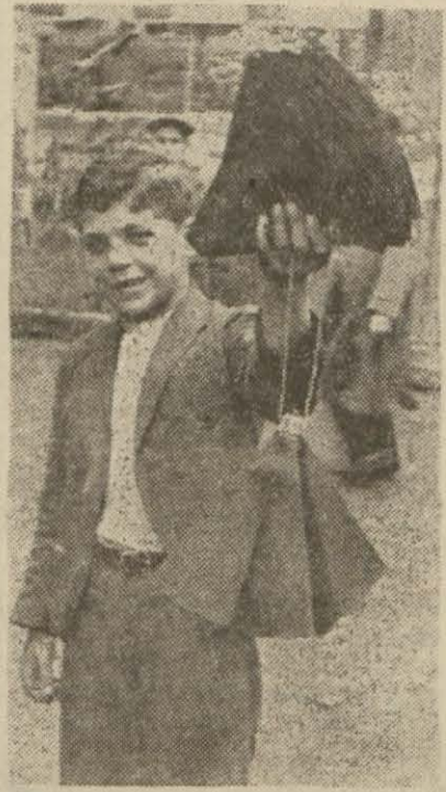
Işık karartma malzemesi satışı

Önümüzdeki ayın ikinci haftası zarfında şehrimizde yapılacak kararlar ile büyük hava denemesi için hazırlıklara başlanmıştır. Bu denemede 11.066 kişi vazife alacaktır. Gaz arama ve temizleme 2567, enkaz kaldırma 2785, teknik onarmada 985, sıhhiyede 957 kişi çalışacak, ayrıca 1511 yardımcı polis, 1612 yardımcı itfaiye ve 611 ev hemşiresi vazife göreceklerdir.