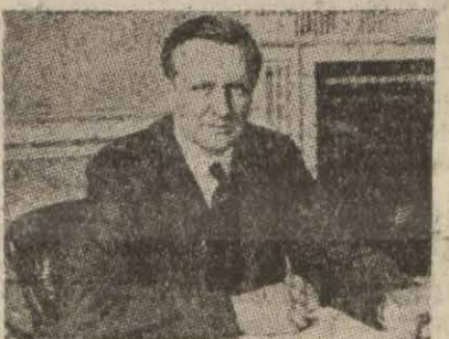
Amerikaya gönderilen İngiltere'nin Vaşington Büyükelçisi LORD LOTHIAN

Amerika, İki Gizli Makine Modelini İngiltereye Gönderdi