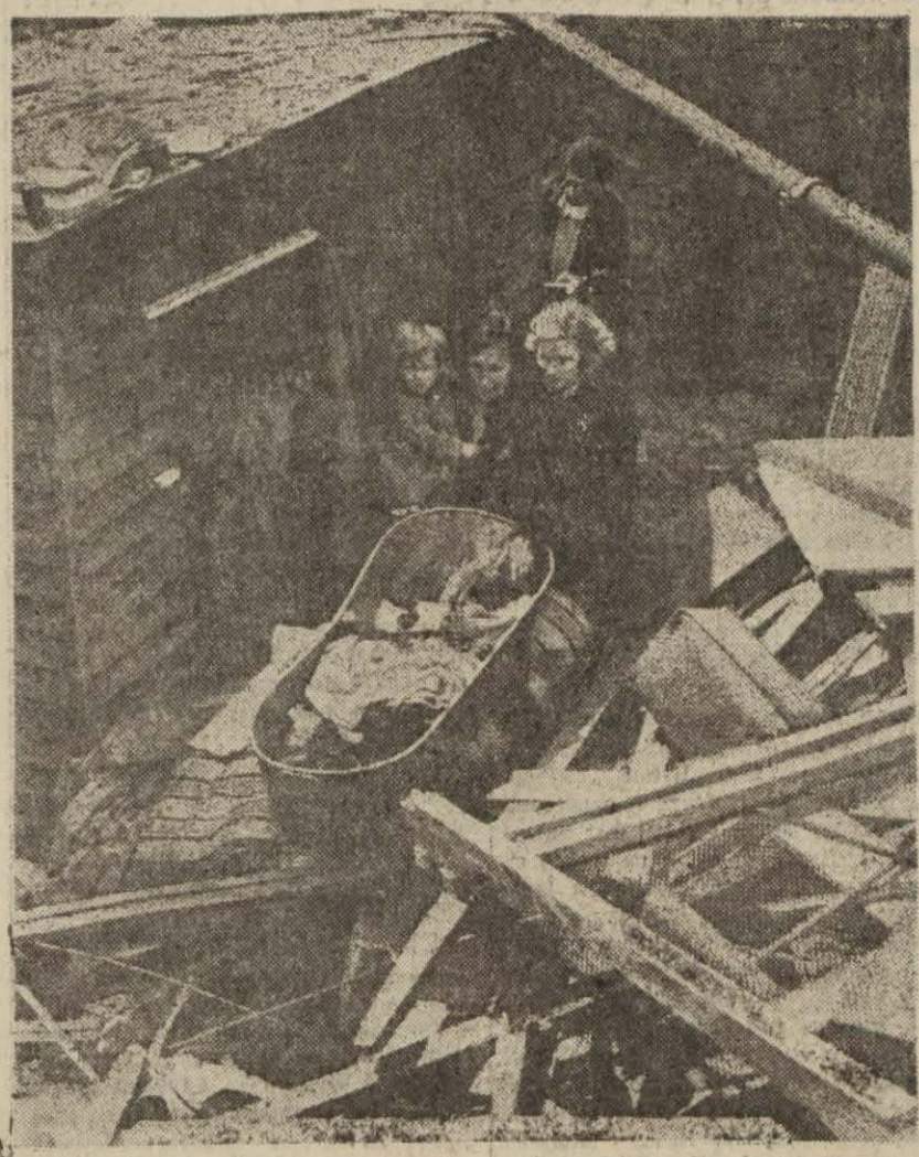
İngilterede hava hücumlarının tahribatına ait bir fotoğraf: Bina yıkıldığı halde, beşikta uyuyan yavru sağ olarak kurtarılmıştır.

İNGİLTERE ŞİLEP ALIYOR Stokholm, 13 (A.A.) — Vaşingtondan bildirildiğine göre, İngiltere hesabına 120 şilep insası ve 63 şilebin de derhal satın alınması için Vaşingtonda bir mukavele imza edilmiştir. İngiltere transatlantik insası için Amerika hükümetine on milyon sterling bir kredi açmıştır. (Sonu Sa. 2, Sü. 5)