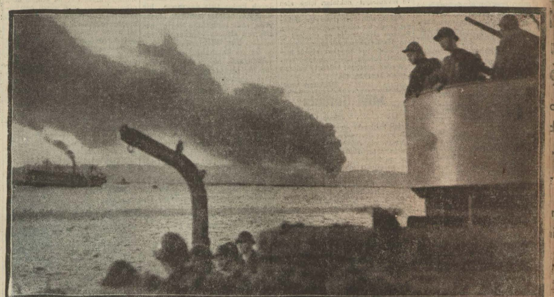
Taranto'ya donanma tayaraları vastasıyla muvaffakiyetli bir taarruzda bulunan İngiliz deniz filosu, bir hareket esnasında

Temmuzda 258 kişi ölmüş, 321 kişi ağır surette yaralanmıştır. (Sonu; Sa: 2 Sü: 2)