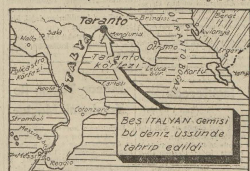
BES İTALYAN Gemisi bu deniz üssünde tahrip edildi

İngiliz donanması, esas cüzümleri müsterih bir surette sahil müdafaalarının arkasında ve başlıca bahri üsleri olan Tarantoda bulunmakta olan İtalyan donanmasına, kendisini felce getiren bir darbe indirmiştir. 11-12 Teşrinisani gecesi bahriye tayaralarımız Taranto'ya bir taarruz yapmışlardır ki, neticesi bu sabah yaptığımız keşiflerle ve fotoğraflarla tesbit olunmuştur. Bu keşiflerle sabit olduğuna göre (Littorio) sınıfından bir zırhlı, ön güvertesi su içine saplanmış olarak iskele tarafına yatmaktadır. (Cavour) sınıfından bir zırhlı karaya oturmuş ve arka tarafı büyük top taretleri dahil olduğu (Sonu; Sa: 2 Sü: 6)