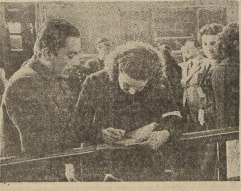
Ankarada trenden çıkan yolcuların sayımı yapılırken (Yazısı ikinci sayfamızda)