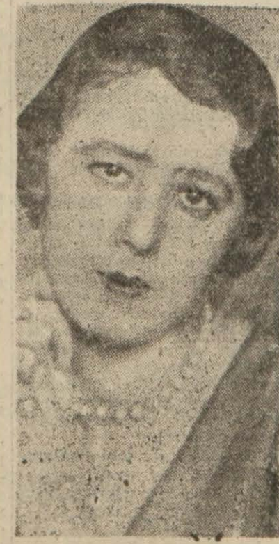
Lupesco — Yazısı ikinci sayfamızda —

Rumen Makamları, Kendisini İhtilâs Suçu İle İtham Ediyorlar