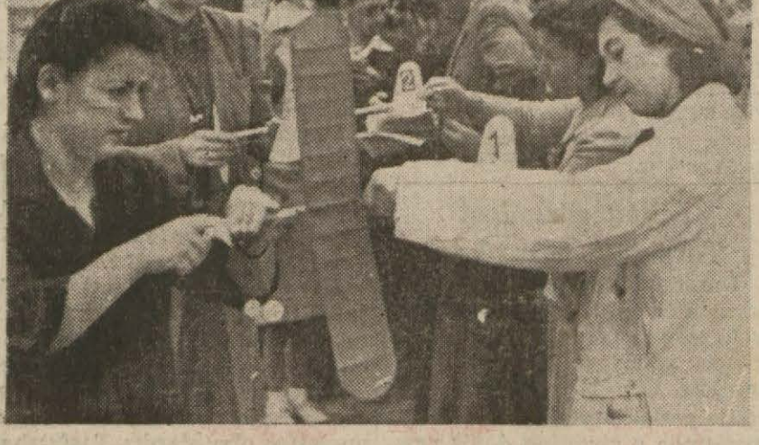
Zincirlikuyuda yapılan dünki müsabakalardan bir görünüşü.

Ankara, 18 (TAN) — Büyük Millet Meclisi bu çarşamba günü toplanacaktır. Bu içtimadan sonra 15 günlük tatil müddeti içinde bütün mebuslar intihap dairelerine giderek halkla temaslara çıkacaklar, idari, iktisadi ve içtimai sahada yapılacak istenilen işlerin nelerden ibaret bulunduğu hakkında halktan geniş izahat isteyeceklerdir.