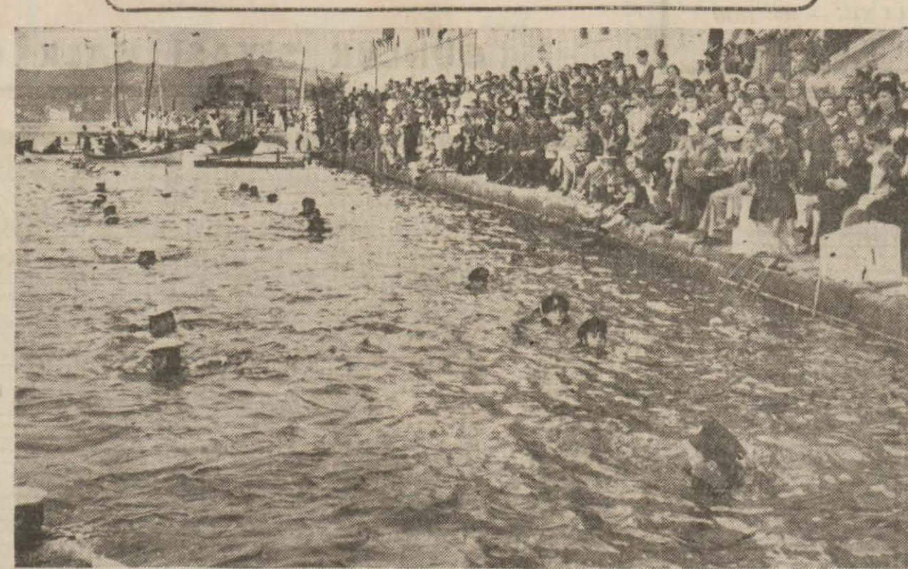
Dün Çengelköyünde yapılan Askerî Liseler Susporları müsabakasından bir görüntü.