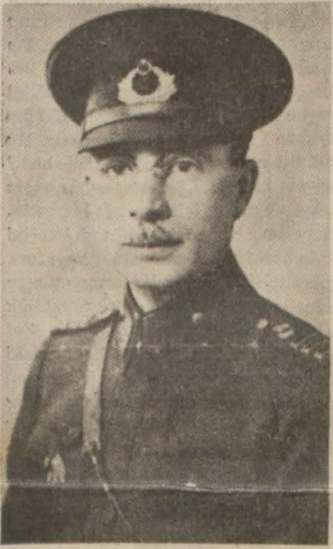
Londradaki askeri heyetimizin reisi Orgeneral Orbay

Londra, 26 (Hususi) — Mister Chamberlain bugün Avam Kamarasında askeri vaziyet hakkında söylediği nutuk sırasında Türk - İngiliz - Fransız anlaşmasından bahsetmiş ve bu paktın tecavüze karşı mukavemet göstermeği istihdaf eden hususî mânâsını ve ehemmiyetini tebarüz ettirerek demiştir ki: