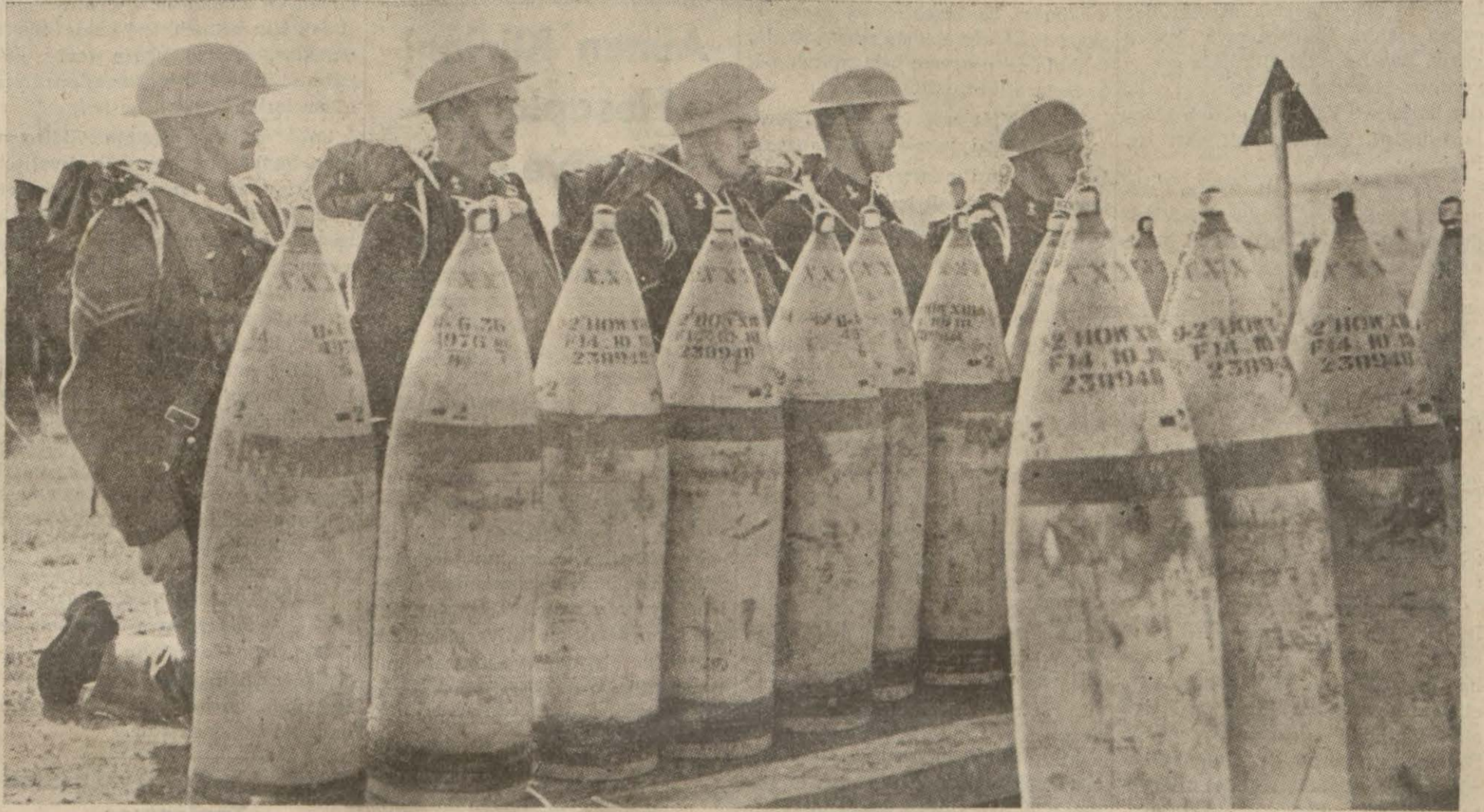
Tam teçhizatla Fransaya nakledilerek Garp cephesine sevkolunan İngiliz kıtaatına mensup bir müfreze