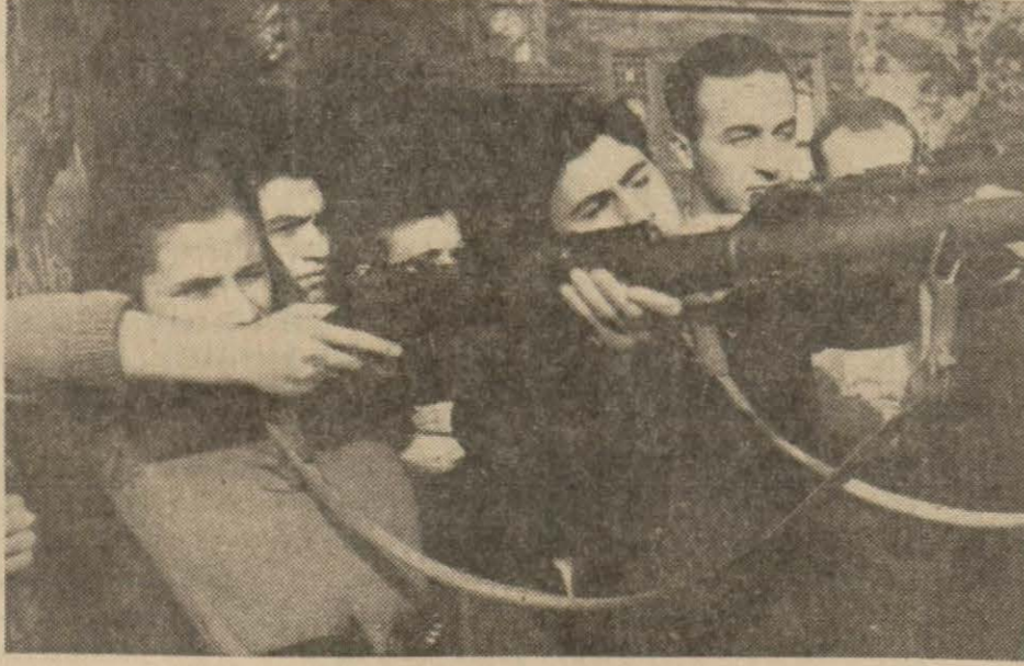
Türk gençliği bir tehlike vukuunda kendisine düşecek vazifeyi tamamlamak için şimdiden böyle çalışıyor

3 — Binek ve nakil hizmeti için orduya yarıyan motörlü ve motörsüz her nevi kara nakil vasıtaları; binek, yük ve koşum hayvanları mevcut, seker, yular, her nevi koşum maddeleri gibi levazım ile binek hayvanları,