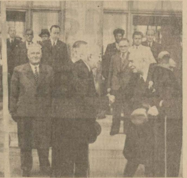
Erzurumdan dönen Vekiller Ankara'da Başvekil tarafından karşılanmıştır.