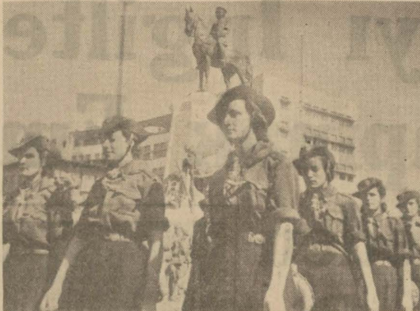
Cümhuriyet Bayramında Ankarada büyük geçit resmine iştirak etmek üzere Ankaraya giden İstanbullu izciler Cümhuriyet âbidesine bir çelenk koymuşlar ve âbide önünde bir ihtiram geçişi yapmışlardır.