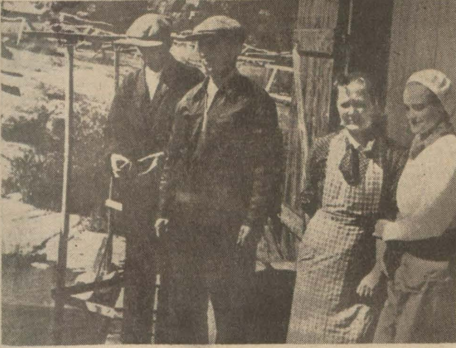
Millî müdafaa için gönüllü kaydedilmeye giden Fin kadın ve erkekleri

Petsamoda Muharebeler Oluyor, Rusların Zehirli Gaz Kullandıkları Bildiriliyor