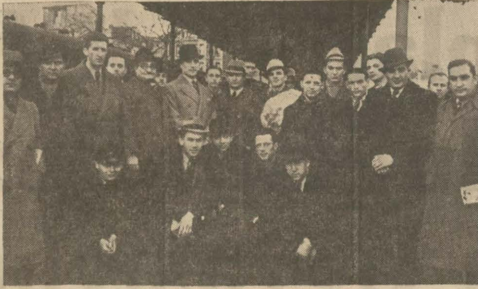
Dün gelen Yugoslav sporcuları..