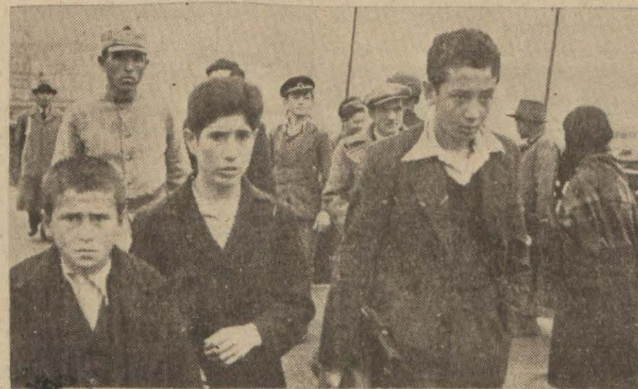
[Yazısı Yedinci Sayfamızda]