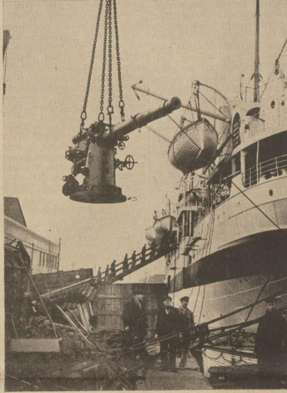
Mayın ve denizaltı tehlikesine karşı bir İngiliz vapuruna, müdafaa için, top yerleştiriliyor..

Meselâ Uzak Şarkta Japonya, yeni kararnamenin tatbikinden en ziyade memnun olacaklar arasındadır. Çünkü uzak denizlerden ve sahillerden rakip Alman sanayiini