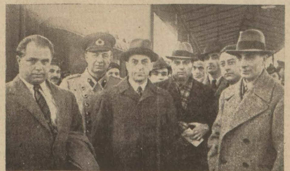
(Yazısı İkinci Sayfada)