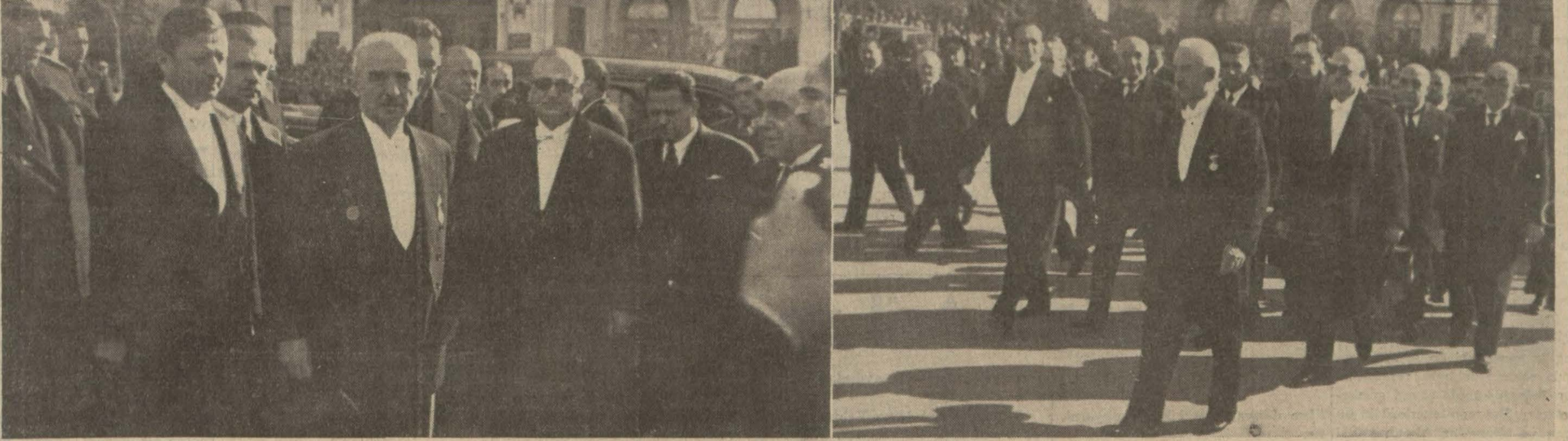
Millet Meclisinin tarihi celsesi; Türkiye'nin İkinci Reiscümhuru İsmet İnönü istikbal ve teşyi olunurken