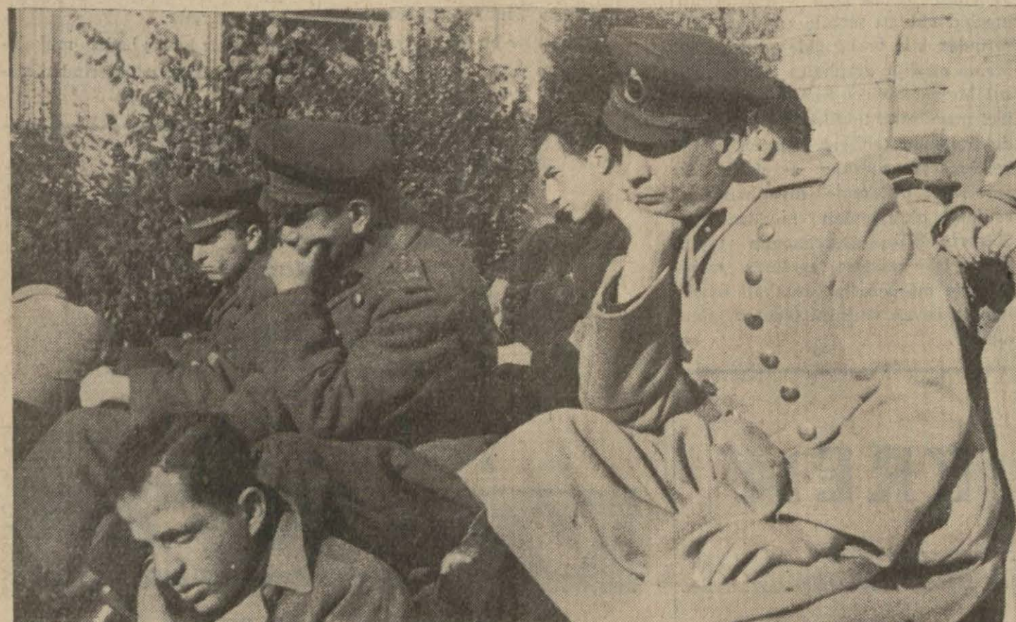
Konferans salonu önünde derin bir elem içinde hitabeleri dinleyen Atatürkün güzide evlâtları genç subaylarımız