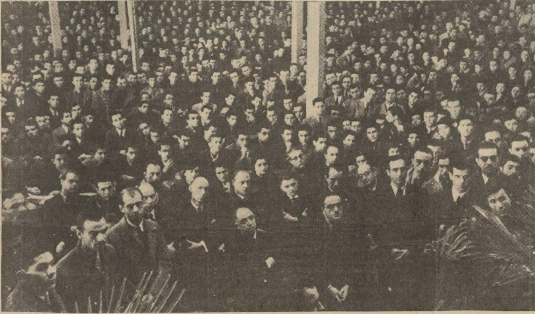
Universite konferans salonunu dolduran profesör ve talebeler, derin bir sükût içinde hitabeleri dinliyorlar