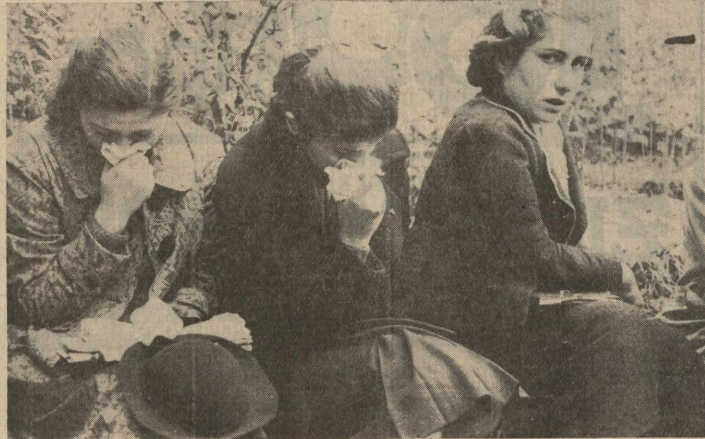
Uç gündür matem ve ıztırapları yatıştırmayan, teessürleri ve gözyaşları sükûn bulmıyan Atatürk kızları Üniversite bahçesinde