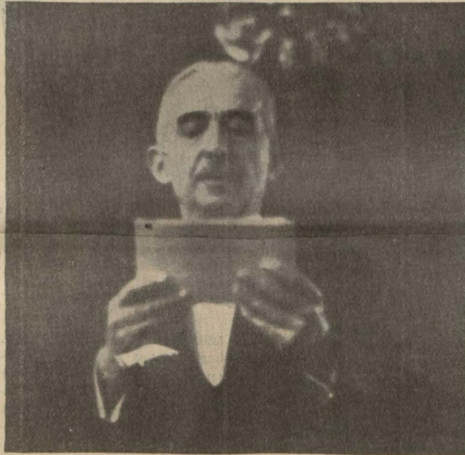
İsmet İnönü, Millet Meclisinde nutkunu irad ediyor

Ertesi yıla daha büyük hamlelerle girdik. Köylünün başına belâ olan âşar kaldırıldı. Şapka kabul edildi. Bu seneler Atatürkün halk arasında çok hareketli olduğu yıllardı. Mütemediyen memket seyahatleri yapıyor, her sınıf halkla temas ediyor ve her biri ayrı hitabet harikası olan nutuklar söylüyordu. O sene şapka kabul olundu. Memlekette hafif tereddüt vardı. Şef yine cezri hareketle bu tereddüdü derhal izale etti. Millet, reisini adım adım takip ediyordu. Tekkeler, türbeler kapatıldı. Dinle dünyayı ayırdıktan sonra softalıgın bu son ilticagâhları da ortadan kaldırılmıştı. Artık her cepheden ve yıldırım hızı ile inkılâplar doğuyordu. Medenî Kanun ile Türk cemiyetine nizam verildi. Adli, idari, içtimai, maarif inkılâpları milletin istikametini değiştiriyor, seviyesini yük-