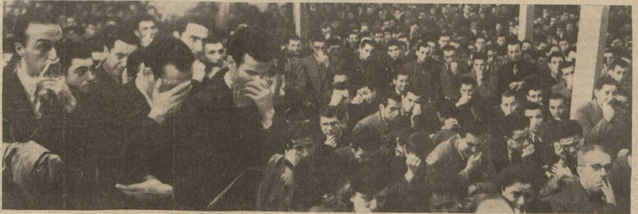
Atatürkün çelik iradeli çocukları dün aziz Atalarını gözyaşı çağlayanları içinde andılar.