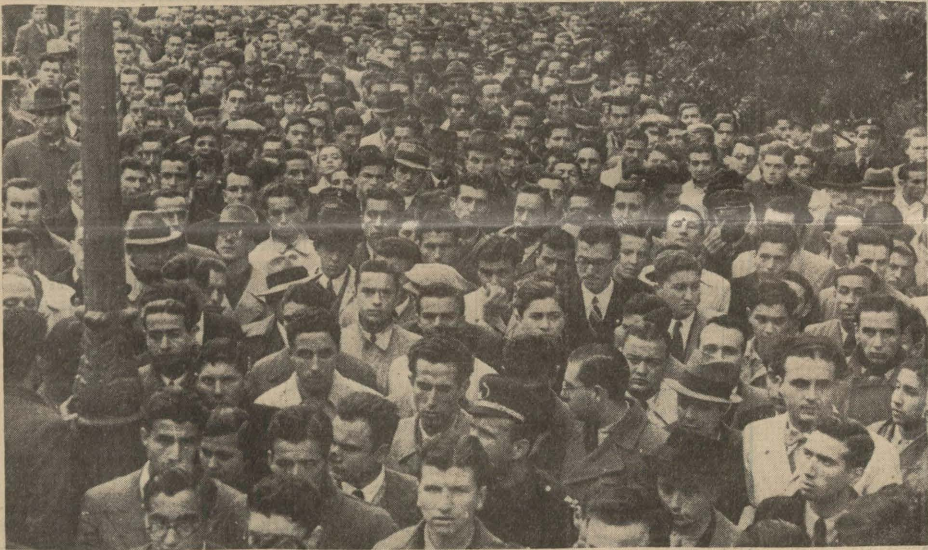
On binlerce yüksek tahsil gençliği, dünkü toplantıda bulunmak üzere, Üniversite konferans salonuna akıyorlar