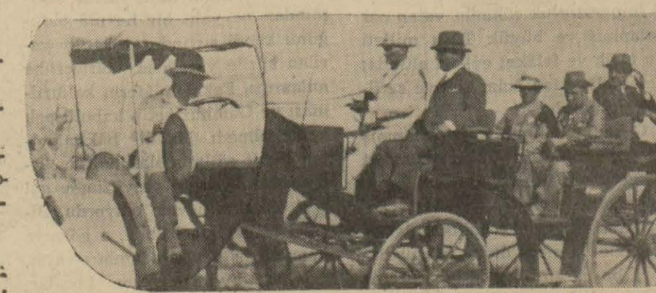
Ulu Şefin hatıralarından: Ankarada, Gazi Çiftliğinde traktörü idare ediyor ve çiftlik arabasını bizzat kullanıyor