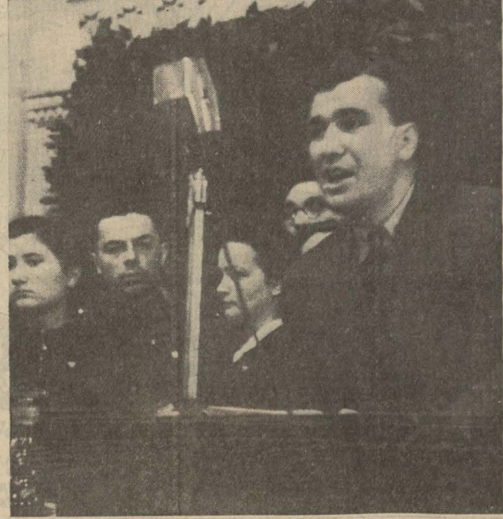
Atatürkün asil çocuklarından biri, Büyük Ataların kayıbt hicranını ve elemi kürsüden haykırıyor