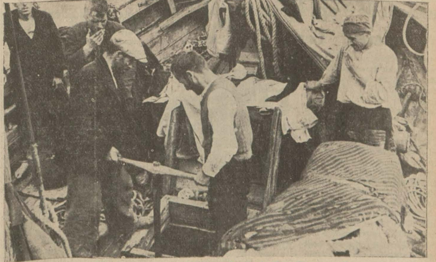
Ölümlü pençelesen felâkette denizciler limanımızda