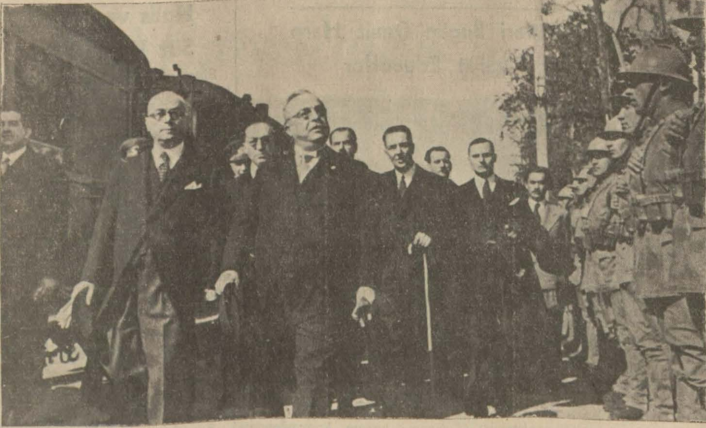
Dost Yunan Başvekiline Ankara istasyonunda selâm resmi

Ademi müdahale konferansı beş saat süren uzun bir toplantı sırasında ehemmiyetli kararlar verdi. İtalya murahhası Grandi, çok alâkaya lâyık bir nutuk söyleyerek İtalyanın gönüllüleri çekme meselesindeki noktalarını anlattı. (Tafsilât 3 üncüde)