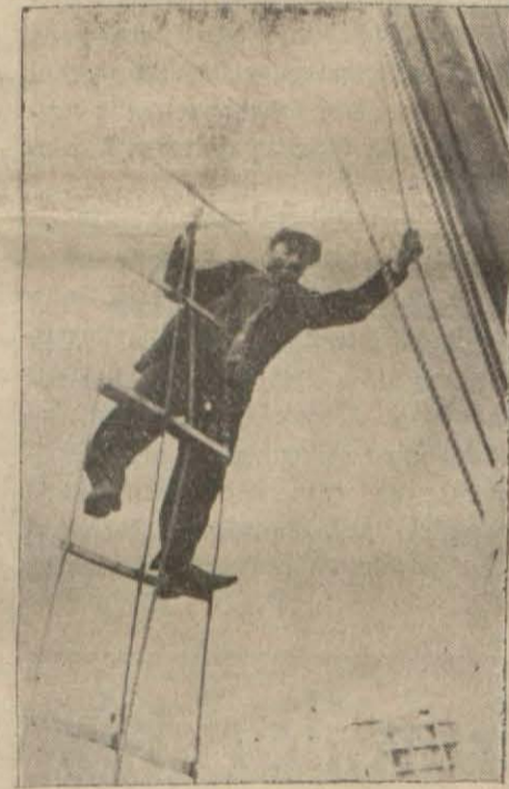
Midyeden limanımıza gelen yelkenlide fırtınanın yaptığı hasarlar temizleniyor

Bir haftadanberi Midye sahillerinde ölümlü pençelesen 25 kazazede denizci, dün katı şekilde kurtarılmışlardır. Evvelki gün, fırtınanın şiddeti yüzünden yoluna devam edemeyerek Büyükdereye dönen Gemi Kurtarma şirketinin Hora gemisi, gece sabaha karşı tekrar yola çıkmış ve dün sabah saat 11 de Sarefes mevkiine varmıştır. Havanın çok sert ve denizin bir hayli dalgalı olması, evvelâ kazazedelerle irtibatı güçleştir-