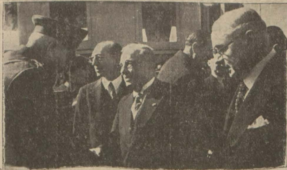
Ankara istasyonunda ilk musafahalar

Dost Yunan Başvekil, İsmet İnönü ve Celâl Bayar'la Görüştü