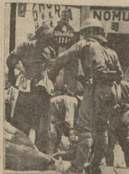
Japon askerleri, beynelmül muntakadan Çin hududuna geçen bir Çinli kadını artıyorlar

Son gelen haberler, Şimalî Çinde büyük bir çete harbinin başladığını bildiriyor. Japon kaynakları harbin başlangıcındanberi Çin zayıatının 10,000 ölü ve 100,000 yaralı bulunduğunu bildirmektedir. Bu husustaki tafsilât üçüncü sahifemizdedir.