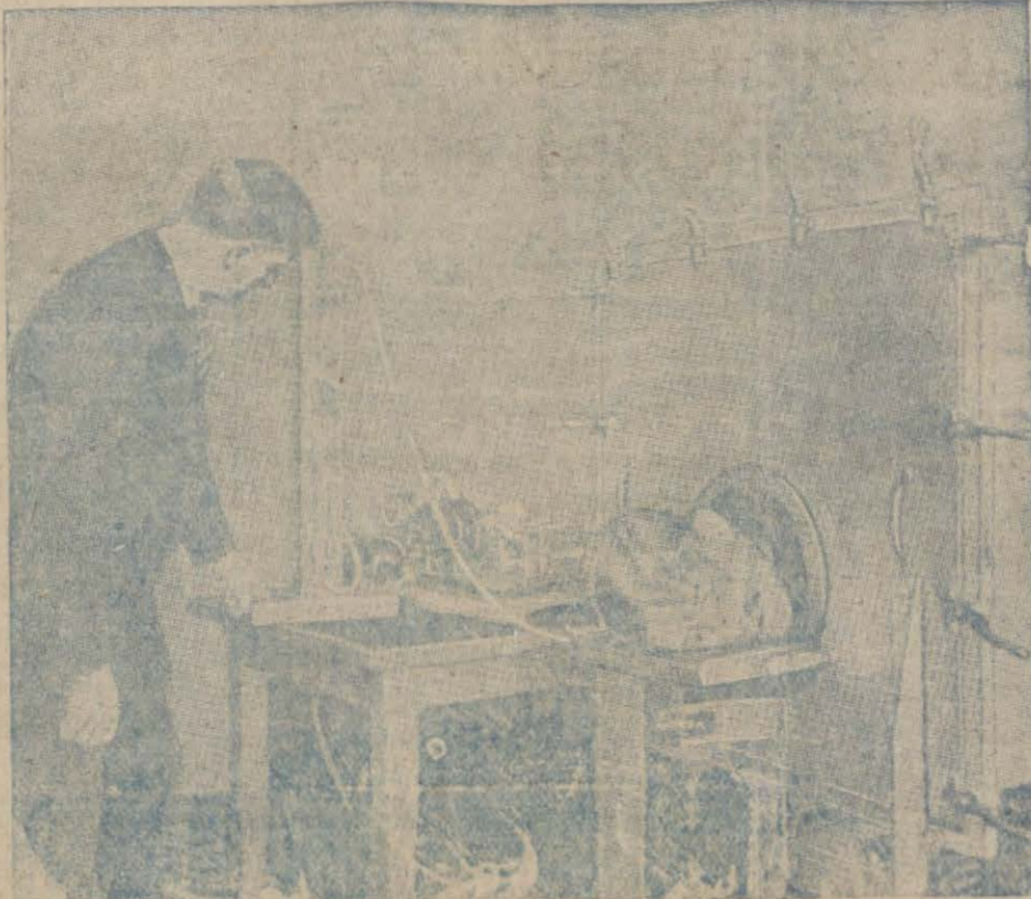
Ölenleri diriltiren makine

yaacak bir hale gelmiş olamaz. Bir kaç zaman evel, (Dalkousie) darülfününü müderrislerin-