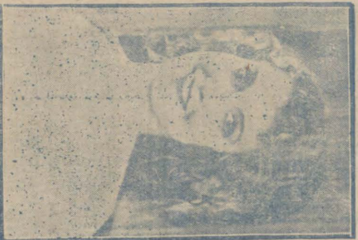
Yeni yıldızlardan Çanak Makdonali

* Sinemada, tehlikeli vaziyetler vücudunda getirmek, halk içinde uyandırdığı heyecan