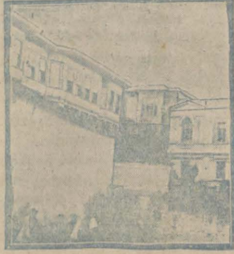
Fenerdeki fesat ocağı

İstanbulda bırakılan Rumların bilhassa Fener kilisesi denilen fesat ocağının memleket hakkında ne derin bir sui niyet beslediklerini hep biliriz. Fakat bunların artık fiili bir şekilde ihanetten vazgeçtiklerini, Yunanistanla velev korkudan olsun münasebetlerini kestiklerini sanıyorduk. Meğer öyle değilmiş; bakınız: