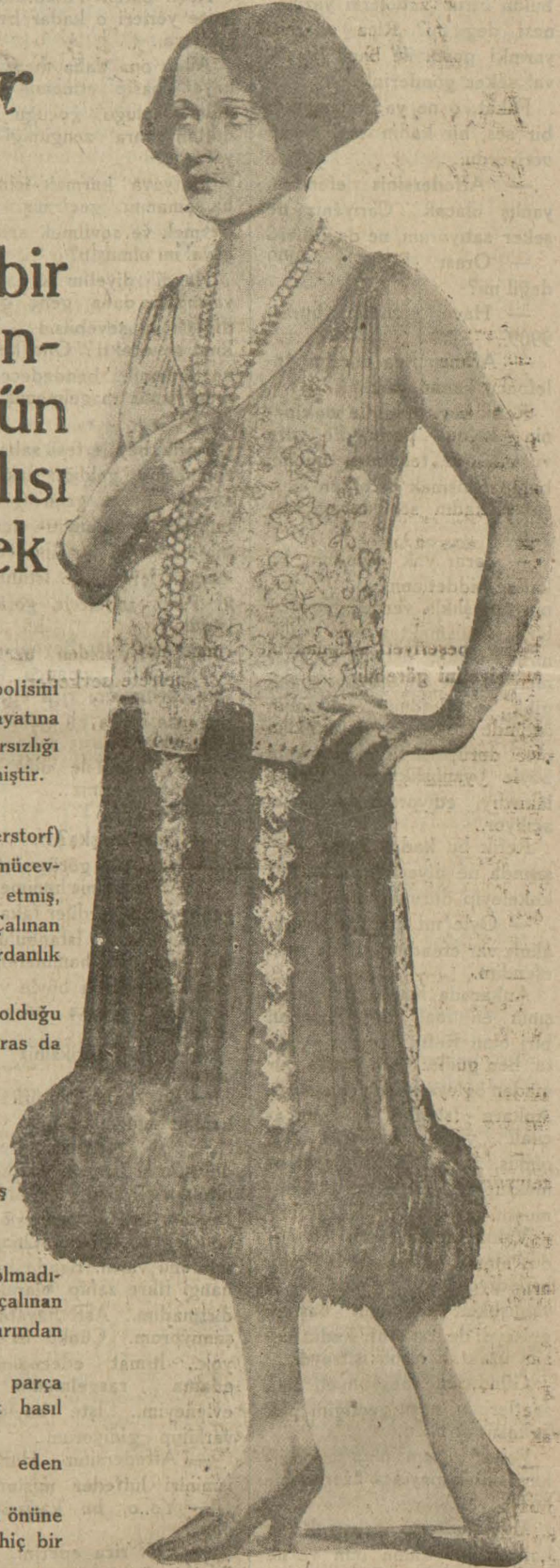
Elmasları çalınan kontes Hermerstorf

Bunun üzerine meseleyi tahkik için nişanlısına haber gönderilerek ifadesi alınmak üzere polise davet edilmiştir. Fakat rezaleti haber alan asilzade bu talden çok müteessir olmuş, tabancasını beynine sıkarak intihar etmiştir.