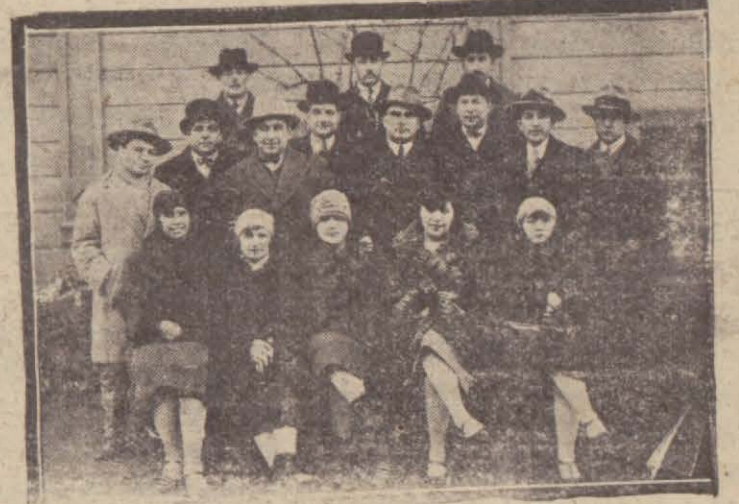
İstikballeri için acı bir teşebbüs yapar san'atkarlarımız

Darülbedayi artistlerinden bazıları, muhtaç, alil ve kimsesiz san'atkarların Darülacezede hnsusî bir pavyonda ihate ve işe edilmeleri mümkün olup olmayacağı etrafında Darülaceze müdürü Cemil beyle temas etmişlerdir.