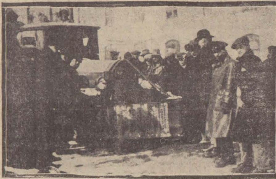
Emanetin yaptırdığı küreme makinesi çalışırken

Şikâyet umumidir Belli, başlı kaza yoktur. Denizlerde don var.