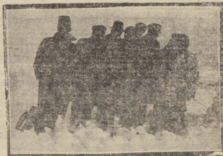
Şişliköyde alınmış bir resim: Sağda insanların ayakları altında gibi duran karaltı, karlara gömülmüş olan lokomotif. Karlar bu kadar irtifa peyda etmiştir

Yalnız, yolların çamurlu ve batacak olması, İstanbulu iyi