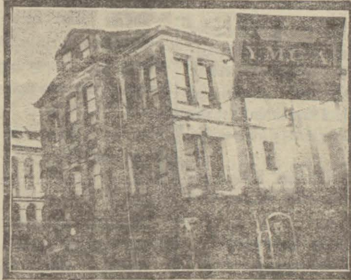
Genç Hıristiyanlar Cemiyetinin İstanbul şubesi ve alameti

(Genç Hıristiyanlar Cemiyeti) kulüp müdür, mektep müdürü? Emanet elyevm bu hususta tetkikat icrası meşgul bulunmaktadır. Müessise mektep olduğunu iddia etmekte ve buna delil olarak maariften aldığı ruhsatnameyi göstermektedir.