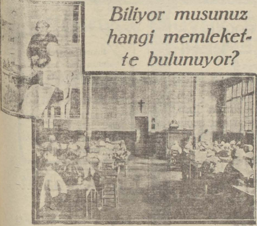
Hapisanenin dahilinden iki manzara

Biliyor musunuz hangi memleket- te bulunuyor?