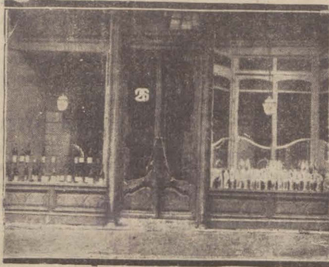
Eczacılar da fiyatları artırıyor.

İspirto fiy. «300» kuruşa çıktı. Bu, der- hal ilaç fiyat- larında da kendisini gös- terdi; hem o derecede ki; tereffü bazı yerlerde ispir- to ile imal edilmeyen ilaç fiyatlarında da mahsus oluyor.