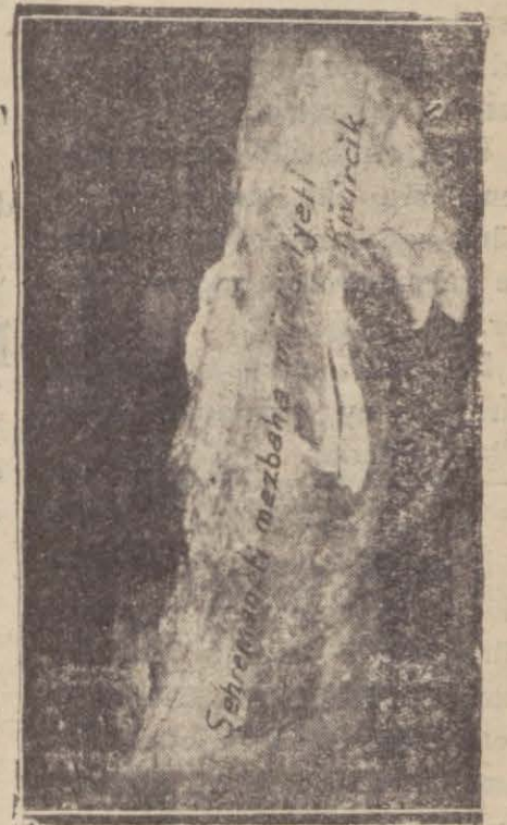
Teştitthane, bu suretle bunların şehrin sıhhatini tehdit etme- lerinin önüne geçilememektedir.

Emanet, bundan bir müd- det evvel etlerin üzerine birin- ci, ikinci, üçüncü nevi, diye damga vurmayı, bu suretle halkın kasaplar tarafından al- datılmasının önüne geçmeyi düşünmüştü. Aldığımız malûmata göre, bu tasavvurunda ahiren sarfı nazar edilmiştir. Mezbaha idaresi, ileri sü- rülen teklifin kabiliyeti tatbi- kiyesini görmemiş, bundan başka bir çok sui istimallere de yol açacağı düşünülmüş- tür. Etlere üzerine eskisi gibi yalnız isimlerini gösteren dam- galar vurulmaktadır. Teştitthane Teştitthane; arsa ve bina meselesi hâlâ halledilmediğın- den yapılamamaktadır. Hayvan leşleri eski usul üzere toprak altına gömül-