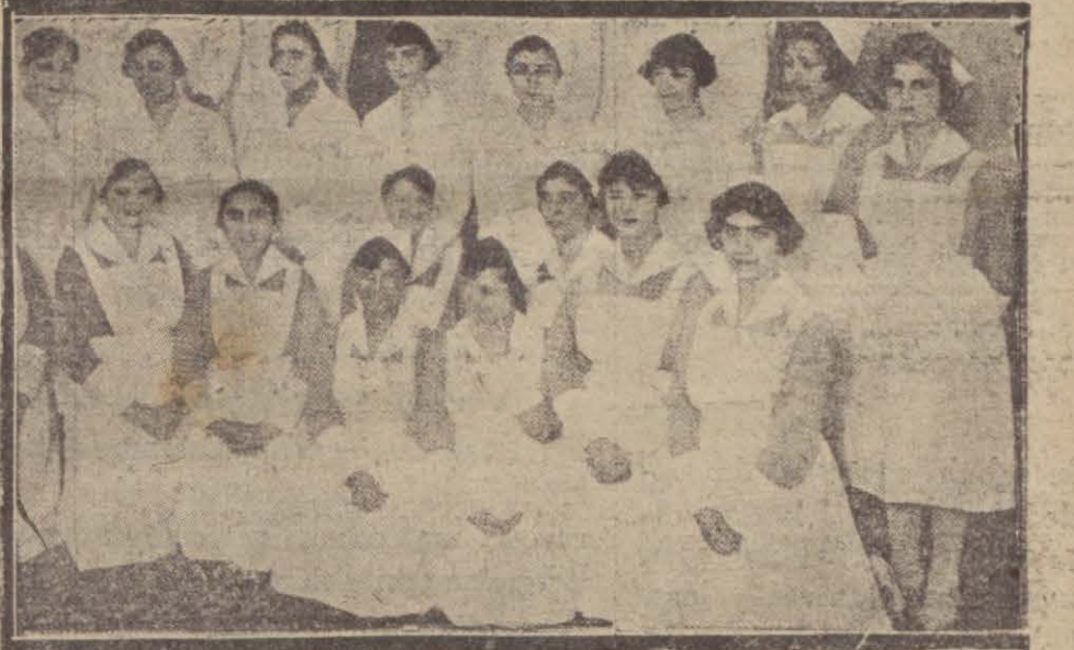
Amerikan hasta bakıcı mektebi mezunlarından bir kısmı

İstanbulda henüz hasta bakıcı mektebi tesis edilmeden evvel Amerikan hastanesinde bir kurs açılmış, sonra burası hasta bakıcı mektebi unvanını almıştı.