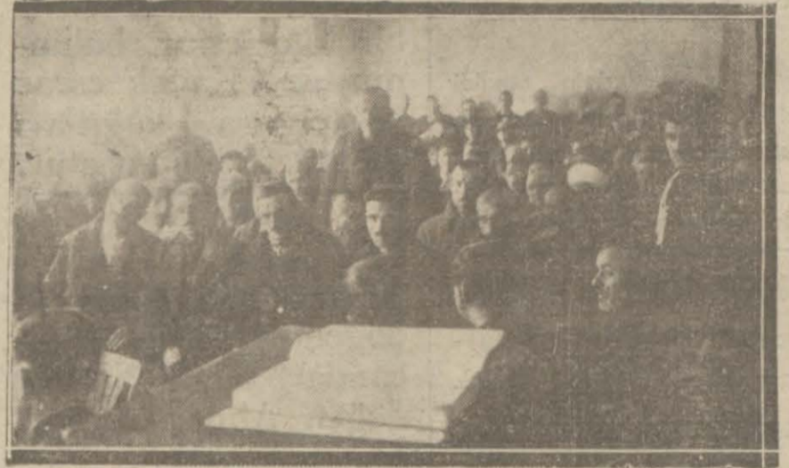
Bursadaki mevkuflar mahkemenin huzurunda

Bursa 21 (H.M.) - Mevkuflar saat 9,5 te otobüslerle ağır ceza mahkemesine getirilmeye başlandı. Mahkeme salonu erkenden meraklılarla dolmuştu. Maznunların muhakemesi bugün de akşama kadar devam edecek ve geçen celsede istivap olunmuşların istivapları yapılacaktır. Muhakemeye saat 10,5 da başlanmıştır.