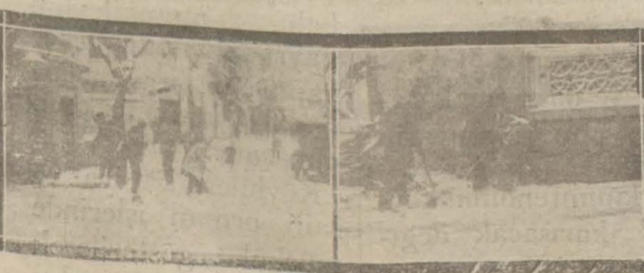
Yukarıda: Bursada karlı bir manzara. Aşağıda: Bu sabah Türk ocağının önü.

Dün geceden beri şehre devamlı bir surette kar yağmaktadır. Rasatane bu sabah saat yediye kadar yağın miktarını 3 santimetre olarak tespit etmekte ise de kar bazı yerlerde 8 santimetreye yakın bulunmaktadır.