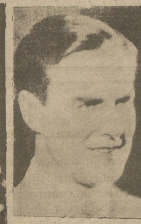
38: POL RHİTTER

Sinema meraklıları karilerimiz için yeni bir müsabaka açtık. Otuz kadın ve otuz erkek resmi koyacağız. Bunların içinde kimi beğendiğinizi bize bildireceksiniz. En çok beğenilen kadın ve ya erkek artiste reyvermiş olan karilerimiz arasında çekilecek kurayı müteakip birinciliği kazanacak zata şehrimizin büyük sinemalarından birinin (6) aylık abonesi, ikinciliği kazanacak zata (3) aylık abone, üçüncüden onuncuya kadar (1)er aylık abone verilecektir. Her gün ilk sahifamızda bulacağınız kuponları biriktirin ve müsabakanın nihayet bulduğu gün bir tanesinin üstüne isminizi ve adresinizi yazarak en fazla beğendiğinizi saatihiz resmi ile birlikte bize gönderiniz.