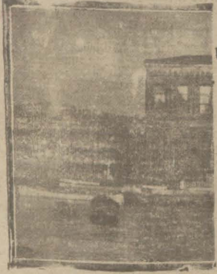
Boğaz içindeki tütün depolarından biri

Etfaiye kumandanlığı, Emanet makamına verdiği bir raporda mahalle içlerindeki ahşap tütün depolarının şehir için daimi bir tehlike olduğunu bildirmiş, bunların bulunduğu yerlerden kaldırılmalarını istemiştir.