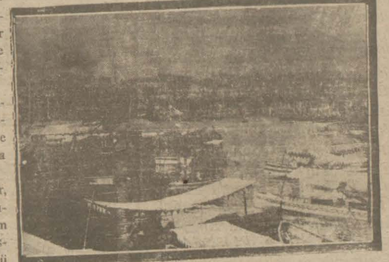
Temizlenmesi hakkında bir rapor verilen Halicin umumi manzarası

Ameliyatın yedi sene süreceği olmasının sebebi şudur: Halic temizlenirken diğer taraftan de dolacaktır. ve hesap nazari itipara alınarak ya-