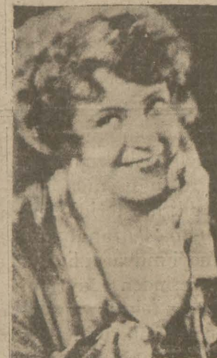
37: MADİ KRİSTİYANS

Film san'atçıları içinde en fazla kimi beğeniyorsunuz?