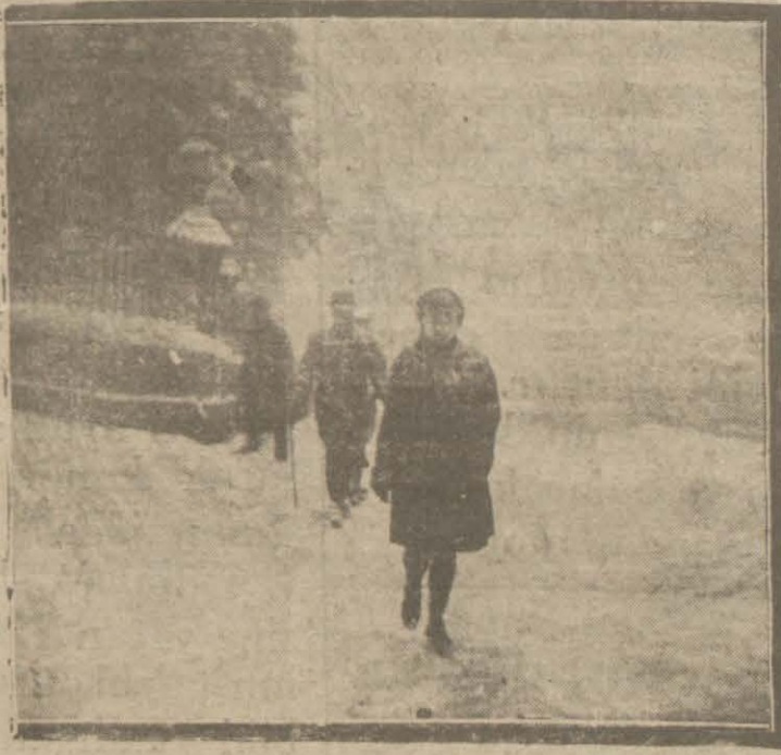
Şehremaneti, kara karşı bir takım tedbirler alıyor

belediyeden sokakları sulamak üzere (5) arozez mübayaasına müsaade istemiştir. Gene nezafet fenniye müdüriyeti için (40) çöp kamyonu ve beygir almak üzere de (25000) lira istenmektedir.