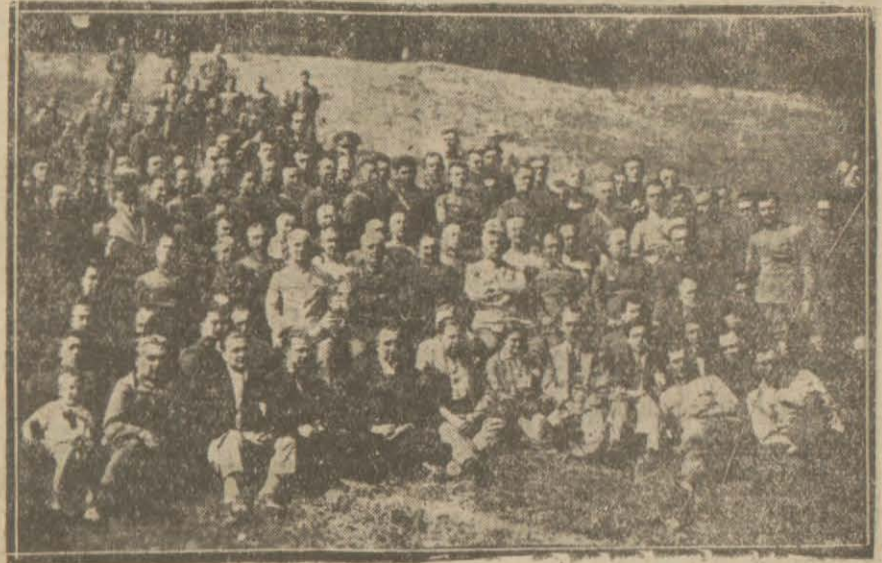
Müstakbel erkânı harplerimiz dünkü gezintide

Harp akademileri müdavim ve muallimleri dün Büyükderede bir tenezzüh yapmış, çok güzel ve samimi bir gün geçirmiştir. Tenezzühe iki yüzü mütecaviz efendi iştirak etmiş, Darüttalimden bir heyet güzel parçalar çalarak nezih ve tatlı bir gün geçirilmesine vesile vermiştir.