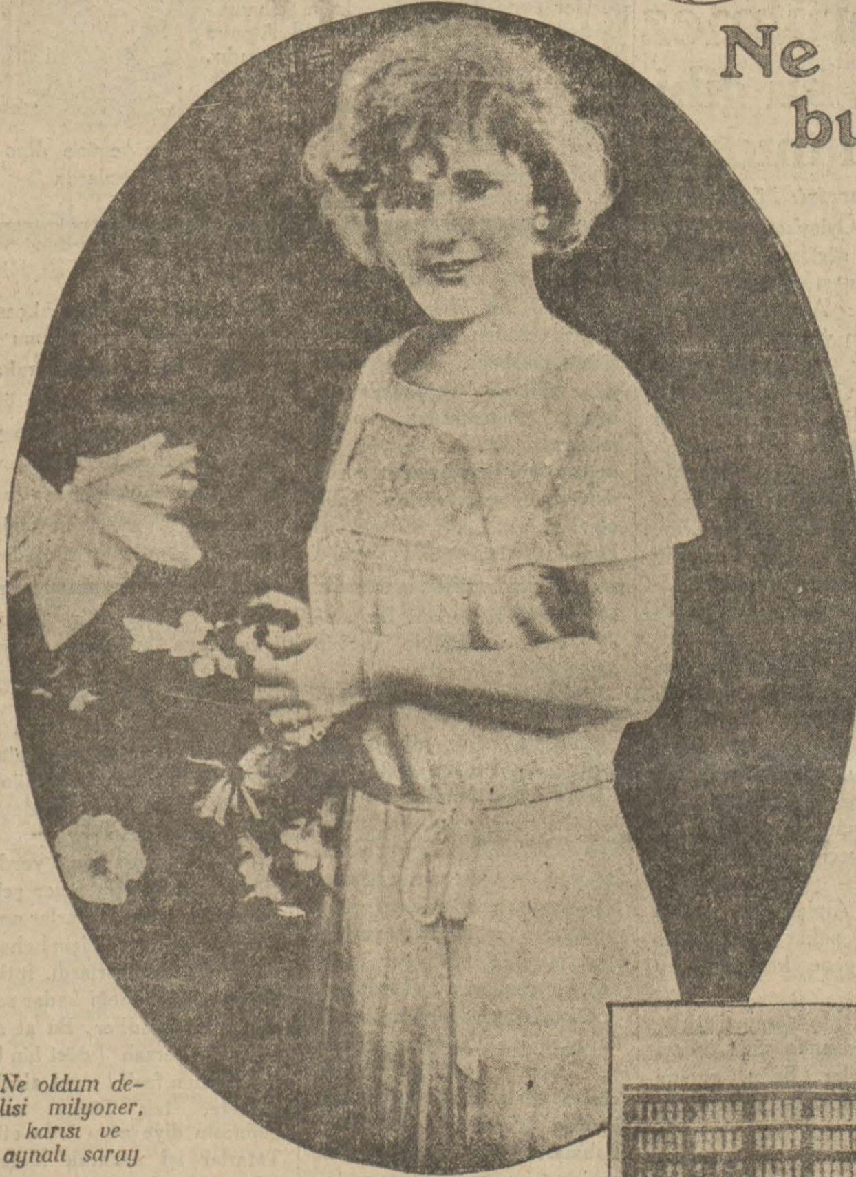
Ne oldum delisi lisi milyoner, karısı ve aynaltı saray