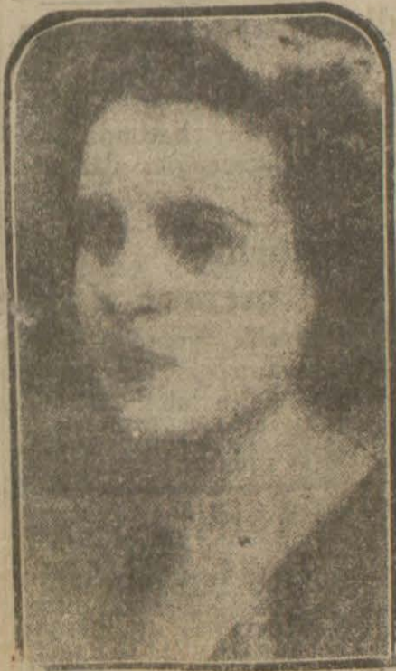
Dünya güzeli Mis Liza

Bir kaç gün evel Galvestonda bu müsabaka yapıp neticelenmiş, ve Avusturyayı temsil eden matmazel «Liza Goldarbayter» birinciliği kazanmıştır.