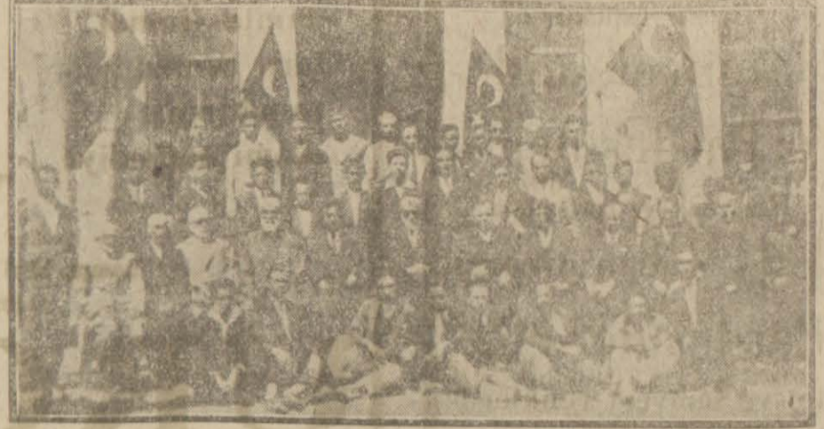
İmam ve hatip mektebinde evvelki gün yapılan merasimden bir intiba

Beş gün evvel şifahi imtihanları biten İstanbul İmam, Hatip mektebi talebesine evvelki gün karne ve şehadetnameleri verilmiş ve mektep tatil edilmiştir.