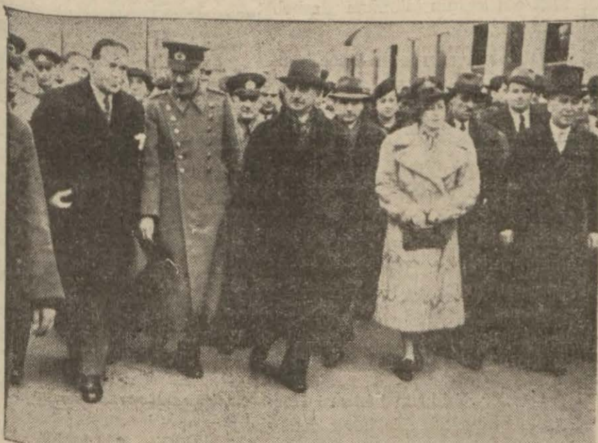
Reisicumhur ve refikaları vapura gidiyorlar

Vekil Doğruca Saray'a Giderek Millî Şefe Bükreş, Belgrad ve Atina Temaslarını Anlatacak