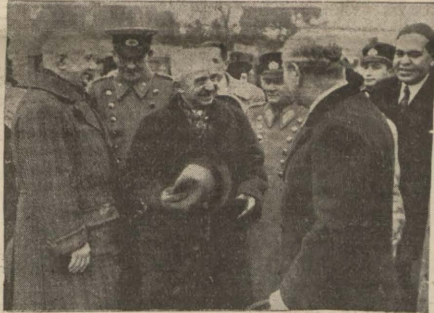
İnönü Fethi Okyar ve Receb Peker'e şifaf ediyor