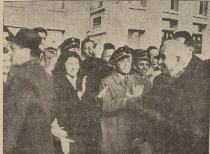
Reisicumhur Üniversite gençleri arasında