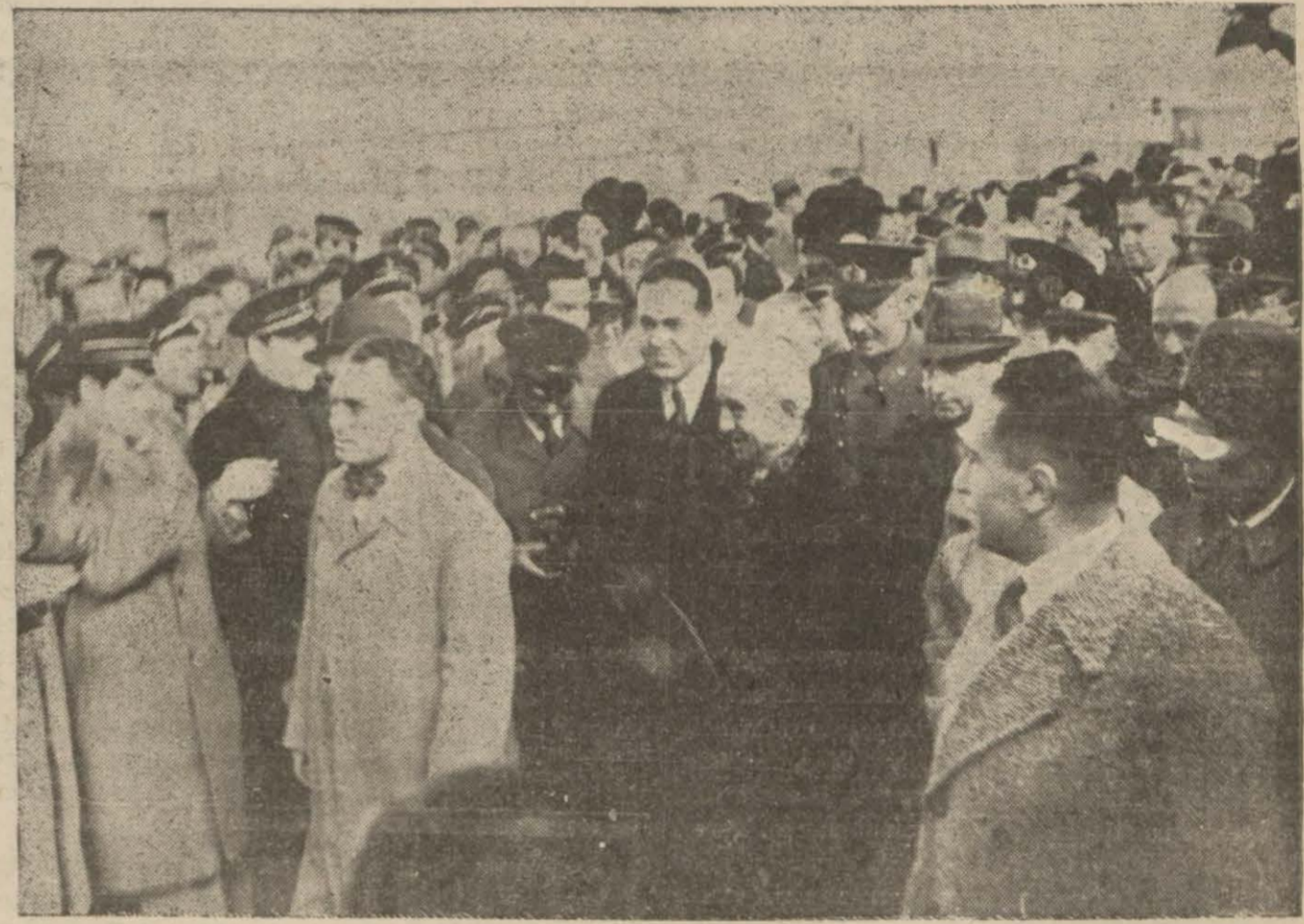
İnönü ve refikaları kendisini karşılayanlar arasında