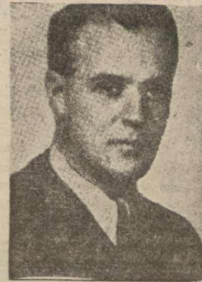
Romanya Hariciye Nazırı Gafenko

Paris 2 (Hususi) — Kont ve komtes Ciyano dün akşam 21.30 da Varşovadan Roma'ya hareket etmişlerdir.