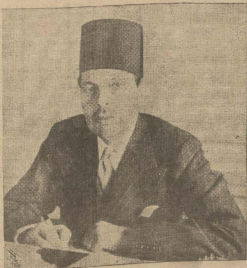
Mısır Başvekil Muhammed Mahmud Paşa ten Büyük Şefle muavinlerin büyük e-

"Sizinle aynı gaye, azim ve imanla sulhün resanetine çalışıyoruz. Türkiyeyi bugünkü mevkie yüksel-