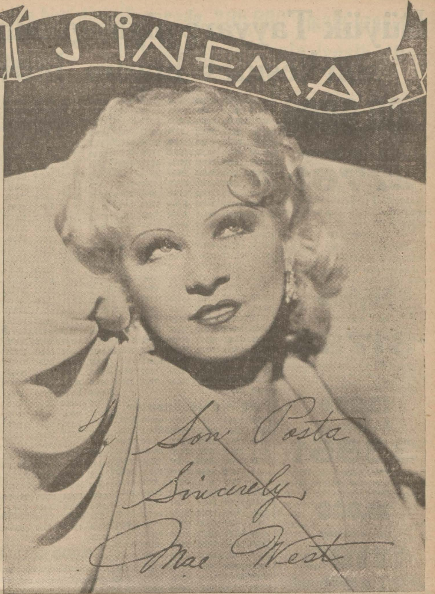
Mae West'in Son Postaya hediye ettiği imzalı fotoğrafı

— Haftanın her günü için muayyen bir listem vardır. Meselâ bugün salı, duher normal kadın için 3000 kalorilik ye-