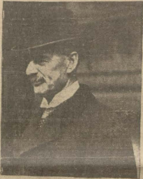
İngiliz Başvekil Chamberlain