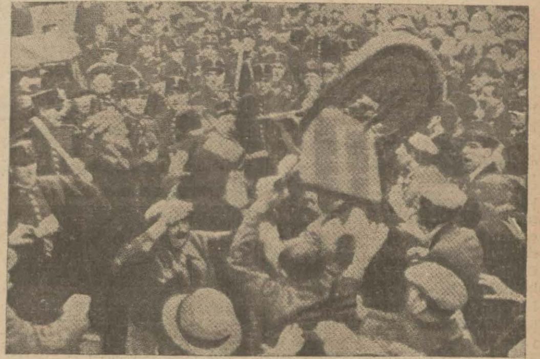
Pariste Blum kabinesi düşmeden önce sosyauistler tarafından ayar önünde yapılan nîmayişlerden bir intiba

Bugün parlamento huzuruna çıkacak olan yeni hükümetin vaziyeti müşkül görülyor