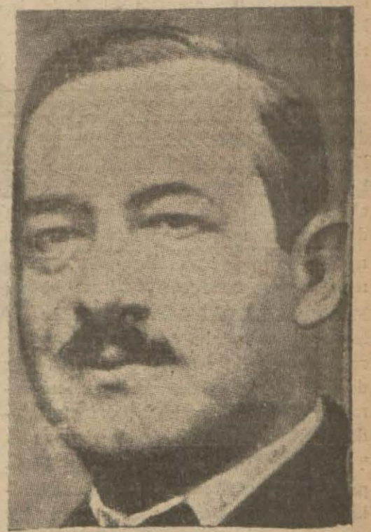
Macar Başvekil Daranyi

Başvekil geçenlerde Yahudi meselesinden bahsederken şu tarzda söz söylemişti: (Devamı 11 inci sayfa)