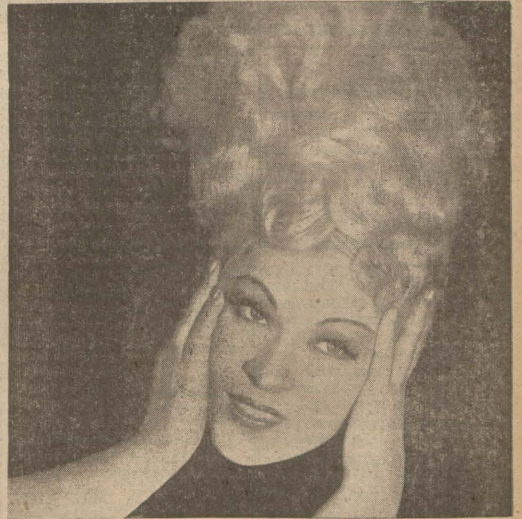
Mae West'in güzel bir resmi

mek odasından makine ile yazılmış bir haftalık listeyi gidip getirdi.