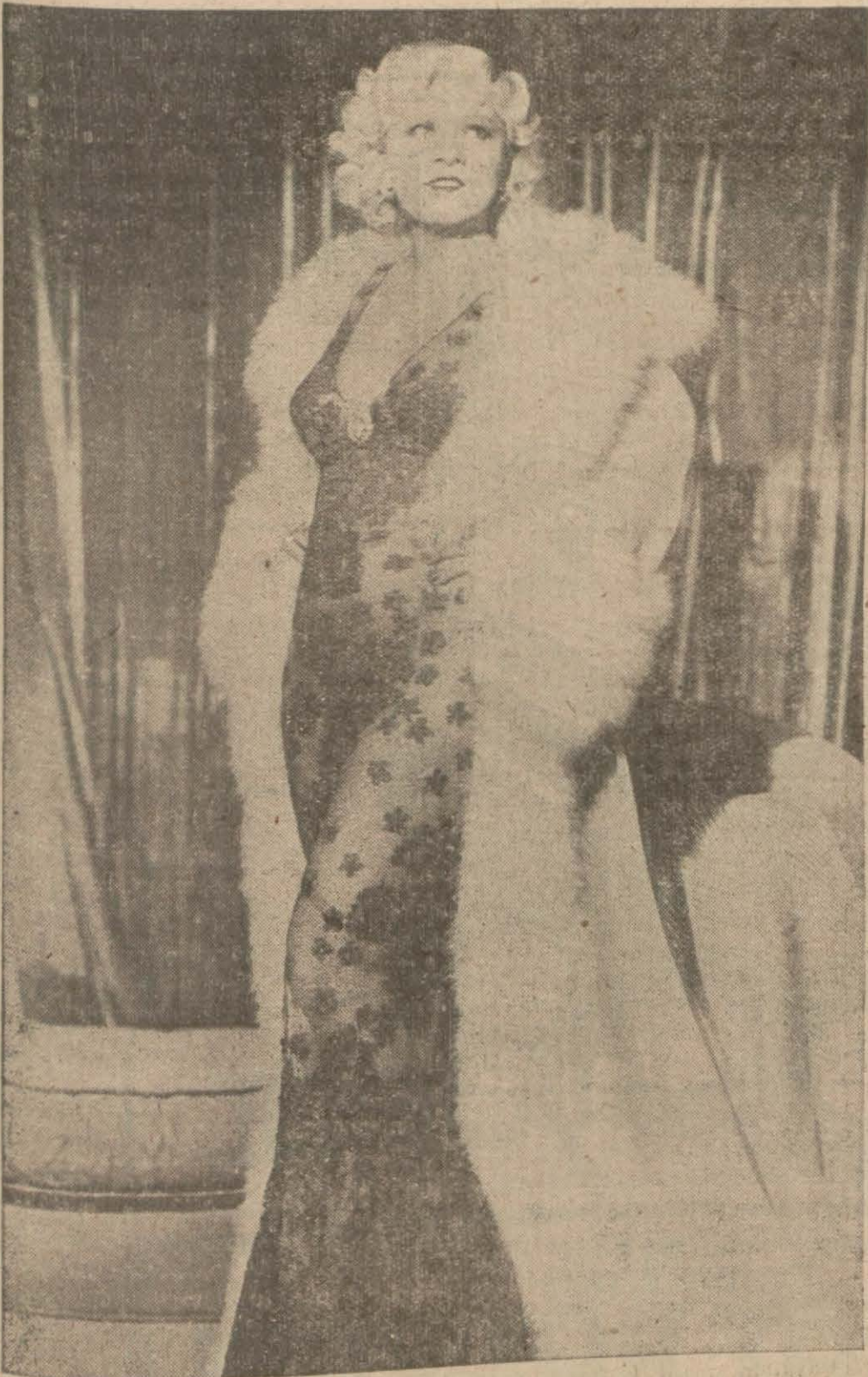
Mae West «Ben melek değilim» filminin bir sahnesinde