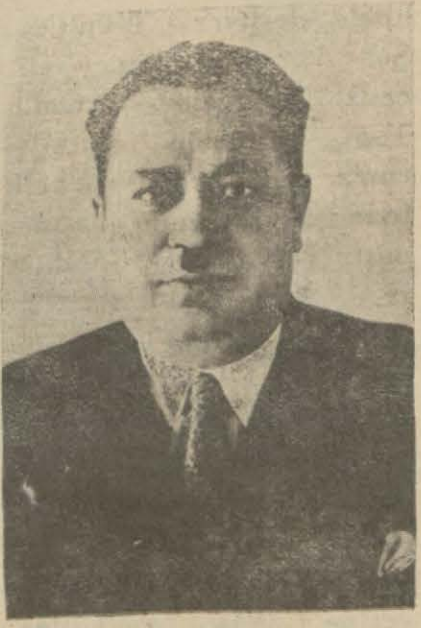
Tefvik Fikret bey Vilâyet kongresi ikinci kânununun 16 ncı çarşamba günü toplanacaktır.

Bu karara göre ocak kongraları 15 eylülde başlayarak 15 teşrinievvelde bitecektir. Nahiyeler 15 ikinci teşrinde, Kazalar 15 birinci kânunda kongralarını bitirmiş olacaklardır.