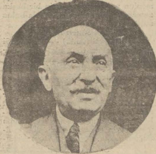
Vaziyete tamamen hâkim olduğu görülen Yunan Başbakanı Bay Çaldaris

Yunanistanın mayaya çağırıldığını ve fakat Venizelosun hattı hareketi buna mani olduğunu ilâve etmiştir.