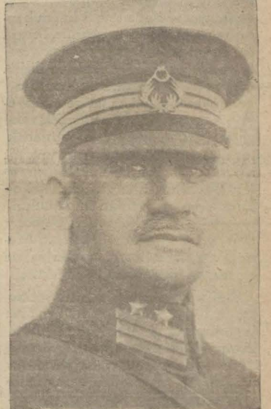
General Şükrü Naili

General İhsan aynı encümenin mazbata muharrirliğine, Erzurum