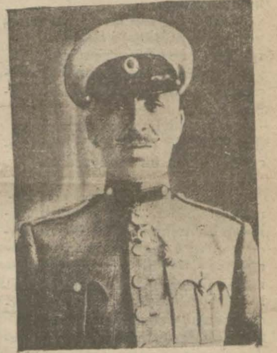
Bulgar Başvekilî General Zlatev

Bulgaristan tahşidat yapmış PARİS, 9 (A.A.) — Anadolu Ajansı (Devamı 2 inci sahifede)