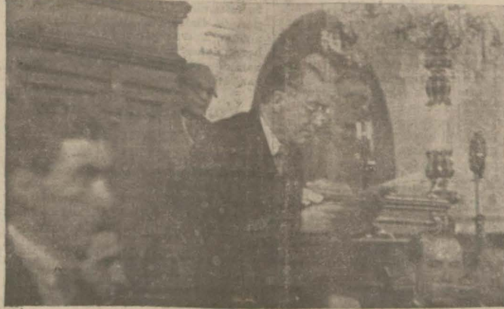
Hariciye Vekili Tevfik Rüştü Bey Meclisin açılış günü nutkunu söylüyor

Arkadaşlarım. Kanunun metni, hendi manasını ve ehemmiyetini hâfi derecede izah ediyorum, zannederim. Malumdur ki Balkan paktı ve protokolu bu sene sonbaharında Cemiyeti Akvama da tescil edilmiştir. Bu misakın sulh ve istikrar yolunda ve âhilerin Balkan dahilindeki hudutlarının emniyeti için beraber çalışmayı esas tutan bir tahkim hükümleri vardır. Bu hükümlerin icabına göre tatbik olunması tabiidir. Ancak bunun için keyfiyetin Büyük Millet Meclisince ayrıca tasvip olunması lâzımdır. Bu sebeple yüksek tasvibi nize arzolan bu kanunda taahhütlerin Büyük Millet Meclisinin itilaf dahilinde olması lüzumu tarih edilmiştir. Bizim teşkilâtı esasımıza ait olan bu hususiyet memleketin yüksek menfaati için olduğu kadar sulh için de ayrıca bir teminatıdır. Büyük Millet Meclisinin itilaf dahilinde olacak taahhütler elbette millet için yüksek menfaatine mutabakatı sukûnetle ve etraflıca mütalea olunarak kabul edilir. Bu kanun hakkındaki marazatı bundan ibarettir. Yüksek kabulünüzü mazhar olacağını ümit etmek isterim.