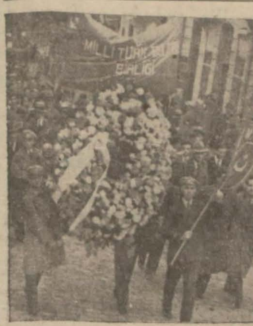
Ziya Gökalp ihtifalinde Milli Türk Talebe Birliği (Yazısı üçüncü sahifede)