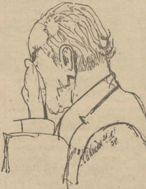
Metr Salem muhakemenin birinci celsesinde ter döküp düşünüyor