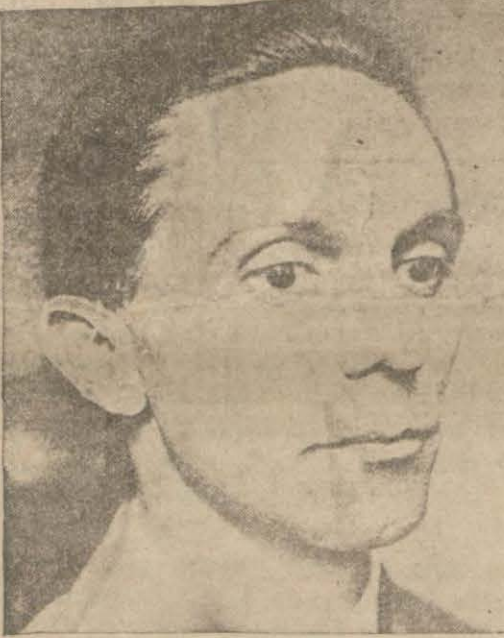
İhtilâli teşebbüslerini ilk evvel haber veren propaganda nazırı Gebbels

Von Papan, hâlâ filen mevkuf bulunmaktadır.