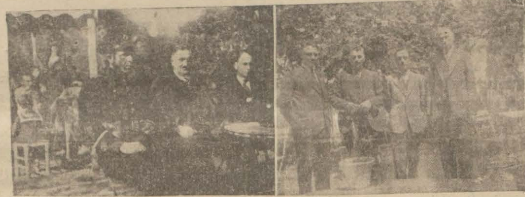
Bursa içmelerine gelenler