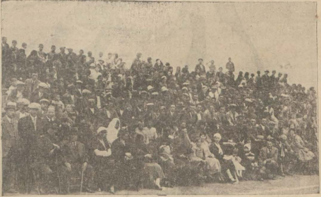
Halk yeni yapılan tribünlerden maçları seyrederken

UŞAK, (Milliyet) — Burada sporculuğa karşı lâkayt kalmadığını gösteren stadyum Uşak belediyesinin çok sayıya teşekkül yarım din ve hizmeti sayesinde yapılmıştır.