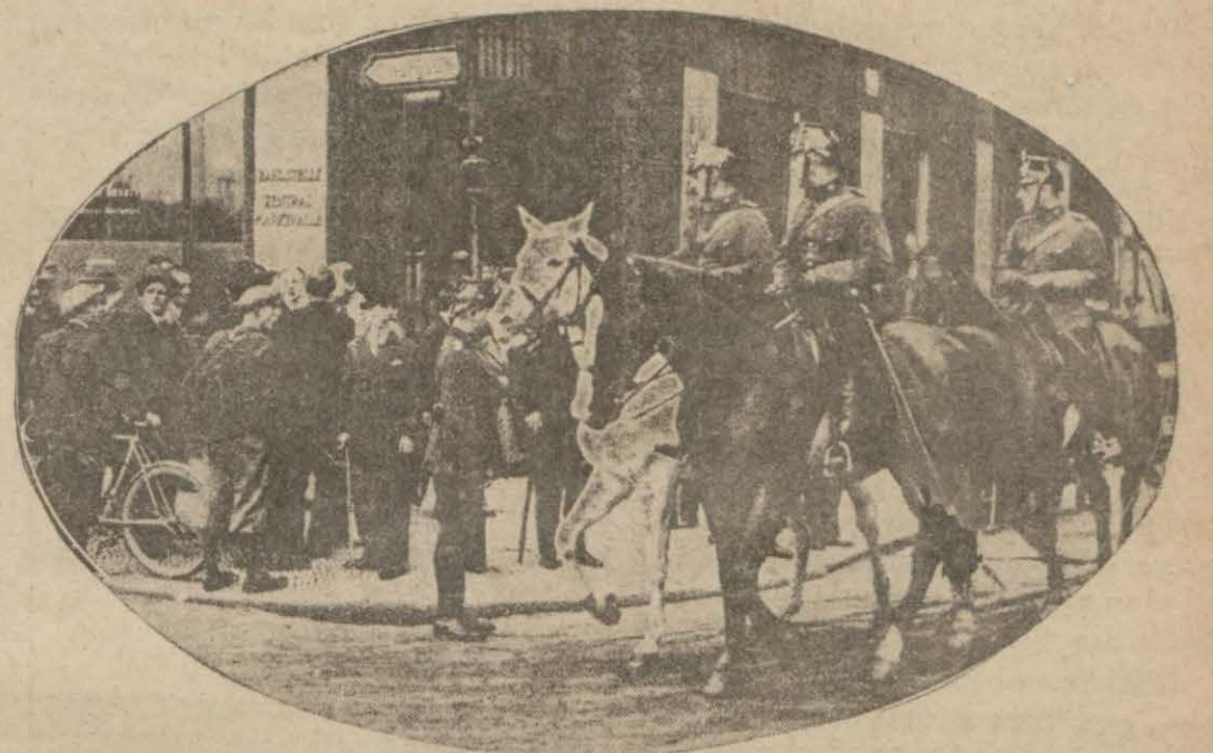
Berlin sokaklarında polis devriyel eri inzibati temine çalışıyorlar...

Reisicumhur Hindenburg, ihtilâli bastırmağa muvaffak olduklarından dolayı Hitler ile Goering'e tebrik telografı göndermiştir.