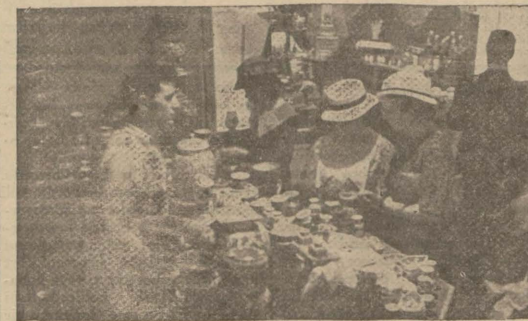
Sergide çini işlerine tahsis edilen pavilyon ..

Suçlu dün mahkemede sorguya çekilmiş, duruşma şahitlerin çağırılmaları için başka güne kal - mıştır.