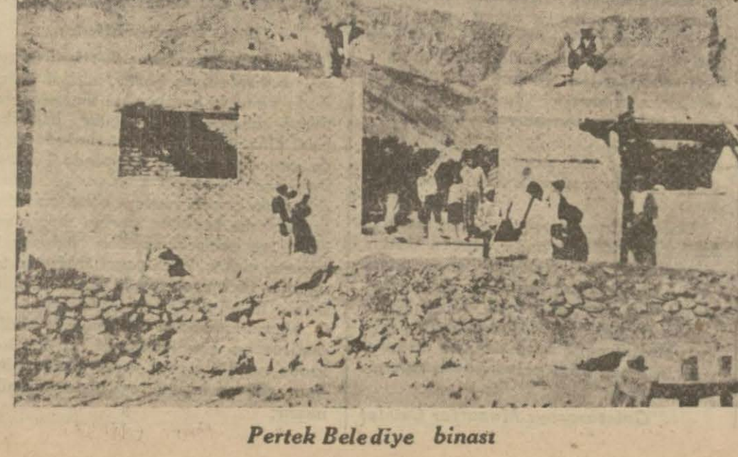
Pertek Belediye binası

Bir seneye yakın zamandanberi Pertek Kaymakamlığında bulu - nan ve pek kısa bir müddet içeri - sinden kendisini muhitine pek çok