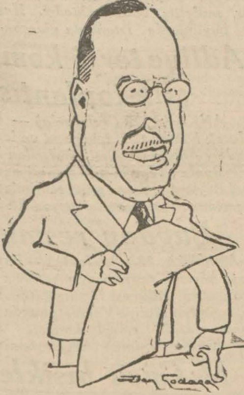
İstifa teklifini reddeden M. Tardieu

Vaziyet tehlikeli görülmektedir. Nazırlardan bir çoğunun istifası çok muhtemeldir.