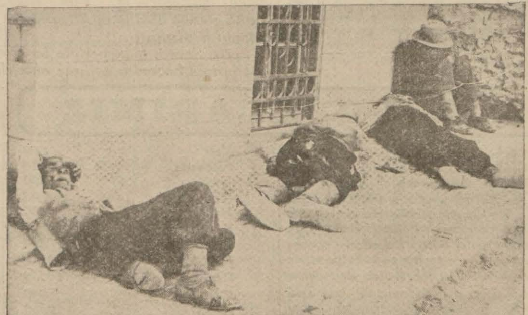
Istanbulda herkes sıcağın başına saracak bir yer arıyor. Bazısı için en serin yer motor, deniz, plâj safası ise bazısı için de cami avlusunda uyumaktır. Hele şu şapkasının altına sığınan ve köşeye sıkışan adamın tatlı tatlı uyuyuşuna bakınız ..

dan bahsederken darülfünunun lâğvedilerek yeni bir üniversite vücutte getirildiğini ve buna bir inkilâp entistüsü ilâve edildiğini ve her talebenin ve enstitüden geçmesi zarurî olduğunu ve otuz dokuz ecnebi muallimin Türk programına ilâve edildiğini kaydetmiş (Devamı 5 inci sahifede)