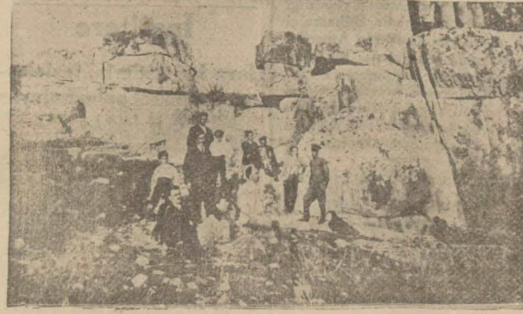
Eski Pertek kalesi

Belediye binası yakında bitiyor- ihtiyacı karşılayacak yeni binalar da yapılacak