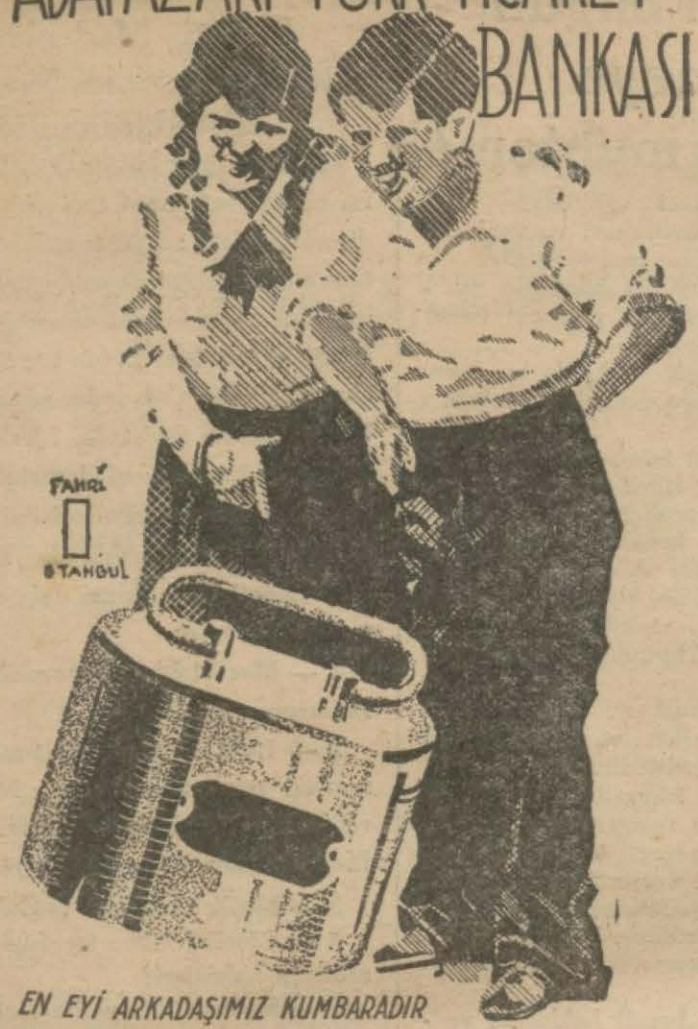
EN EYİ ARKADAŞIMIZ KUMBARADIR