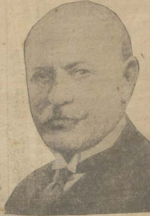
Bulgar Başvekili M. Muşanof balde de yine iyi ve dostane olacağına kanidir.

"— Cenup komşumuz olan Türkiyeye bir dostluk ve bitaraflik beri Türk matbuatının Bulgaristanı karşı kullanmakta olduğu galeada Gazi Mustafa Kemal başkanın akil ve münevver siyaset adamlarının telâkkilerine ve arzularına tevafuk etmekte olduğunu hiç zanetmem. Bilâkis Türk devlet adamlarının Bulgar milletinin Türkiyeye karşı beslemekte olduğu ihlas ve dostluk hissiyatını bilmedikleri ve yekdiğerini tanıyan ve mütakabilen takdir eden iki millet arasındaki münasebetlerin istik-