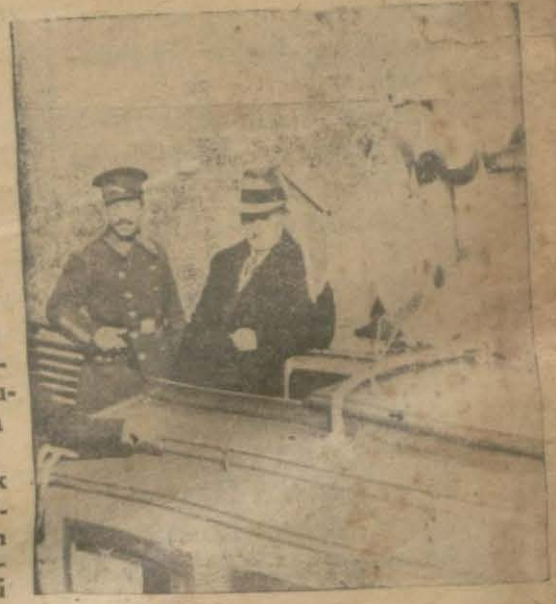
Maiotis'de nöbet almaya giden zabıta memurları motörde

Evrak gelince İnsull'un asliye ceza (Devamı 7 inci sahifede)