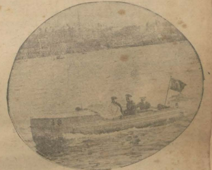
Mütemediyen dolandırıcı bankerin içinde bulunduğu vapur etrafında dolan polis motorlerinden birisi...

Dolandırıcı bankere ait evrak bugün Ankaradan gelecektir.