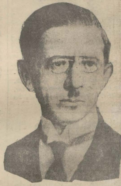
Maliye vekili Fuat Bey

ANKARA, 5 (A.A.) — Yunanistan harbiye nazırı Ceneral Kondilis hazretleriyle maiyeti erkânı bugün saat 9,50 de şehrimize gelmiştir.