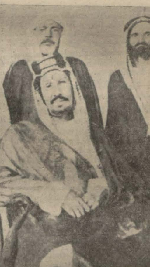
Romadan görüldüğü göre bütün Arabistanda hâkim bir krallık peşinde koşan Hicaz Kralı İbnissuud vezirleri ile beraber...

KAHIRE, 5 A.A. — Royter Ajansı muhabirinden: Hüdeydedeki İtalyan tebaasını korumak için üç İtalyan harp gemisi mezkûr limana gitmiştir. İbnissuudun itaatını ileri harekâtı devam etmektedir. Hicaz hükümeti, yeniden işgal ettiği arazide idarenin bütün