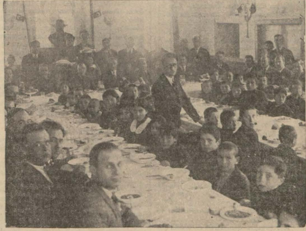
Fakir çocuklara Ordu Halkevinde öğle yemeği yedirilirken.

ORDU, (Milliyet) — Vilâyet merkezimizde beş ilk mektep vardır.