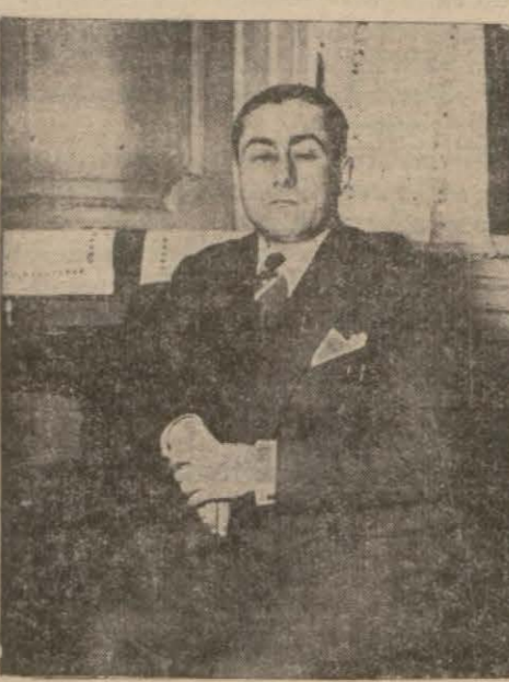
Selânikten bir harp tayyaresile şehrimize geldiğini yazdığımız Fransız tayyarecisi Costes Eskişehirli