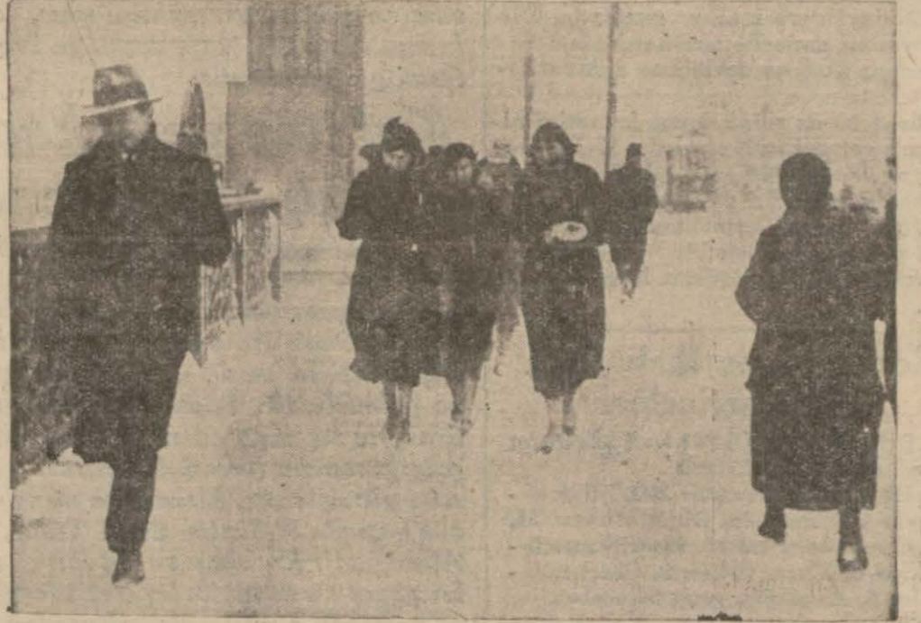
Her gün mahşer yeri gibi kalabalık olan köprü üstü dün kar fırtınasından tek ve tenha idi.

Karlık, olanca şiddetle hükümünü sürmekte devam ediyor. Beş gün evvel başlayan kar, dün de akşama kadar ekseriyetle kesif tipi halinde ve kısa fassalılarla yağmakta devam etmiştir. Soğuklar, bir gün evveline nisbeten şiddetini arttırmış, şehrin muhtelif semtlerinde sular donmuş, etraf ve tenha meydan ve sokaklar on santimetreden fazla irtifada karla bembeyaz örülmüştür. Dün akşama doğru en işlek caddelerde bile birkaç santimetre kar vardı. Tramvay şirketi, dün sabah yollara tuz dökmürek hat güzergâhındaki karları eritmeye çalışmıştır. Şirket, dün muhtelif saatlerde önünde karı hattın iki tarafına mağaya yarıyan demir süpürge tertibatını (Devamı 6 ncı sahifede)