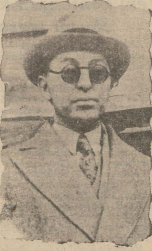
Hariciye vekili Tefvik Rüştü B.

ANKARA, 23. A.A. — B. M. Meclisnin bugünkü ruznamesinde hükümetimizle Çekoslavyaya, Romanya, Sovyet sosyalist şuralar cumhuriyetleri ittifak ve Yugoslavya hükümetleri arasında tecavüzün tarifi hakkında 4 temmuz 933 de Londrada imza edilen mukaveleyle yine hükümetimizle Afganistan, Estonya, İran, Letonya, Lehistan Romanya ve Sovyet Sosyalist şuralar cumhuriyetleri ittifak hükümetleri arasında tecavüzün tarifi hakkında 3 temmuz 933 de Londra'da imza edilmiş olan mukavelelerin kabul ve tasdikine ait kanun lâihaları bulunuyordu.