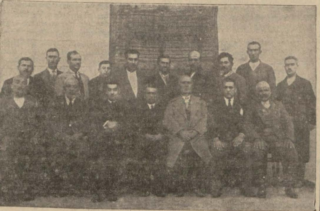
Germencik nahiye kongresinde bulunanlar