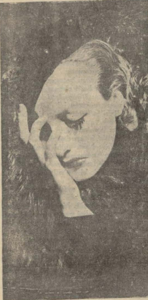
Joan Crawford'un münâsi resmi

che: Helen Hayes, Clark Gable, Lewis Stone.