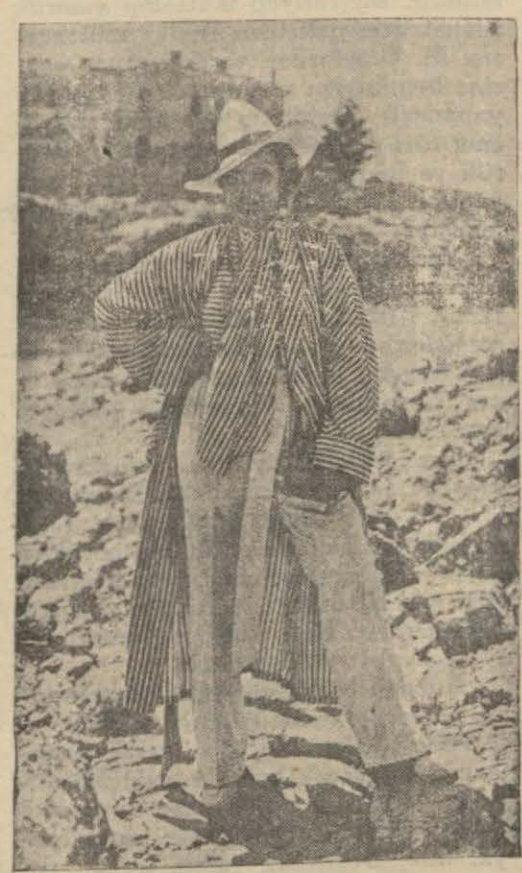
Marlene Dietrich Akdeniz kenarlarının tatilini geçiriyor

Amerikada (Kleopatra) nın hayatına ait bir film çevireceği büyük tantana ile ilân edilmiştir. (Ben Hur) ününü çevirmiş olan sahne vâziri Cecil B. Mille tarafından çevirecek olan bu filmde (Kleopatra) rolünü Clouette Colbert yapacaktır. Antoine rolünü de meşhur Frederic March deruhte edecektir. Jül Sezar rolünün artisti daha seçilmemiştir.