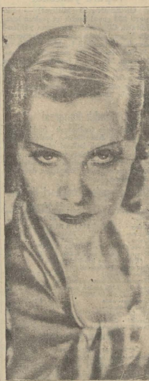
Rusya çarı İkinci Nikolann yeğeni ve sinema artisti Nathalie Paley

bir şeyin, hattâ kocasından boşanmanın bile sinemadaki hayatına ve fa-