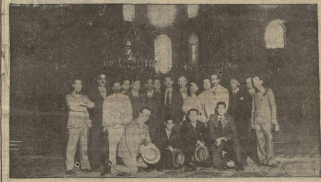
Mısırlı misafirler dün camileri gezdi ler. (Yazısı iş sahifelerimizde)