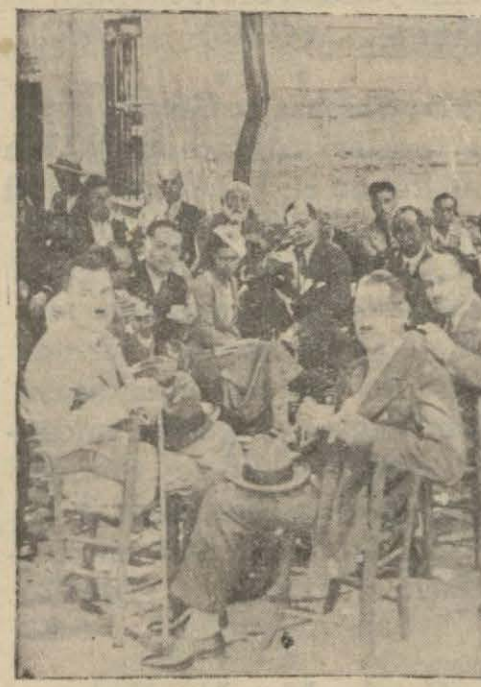
Mısırlı misafirler açık İstanbul kahvelerinden birinde

Dün Belediye tarafından şereflerine ziyafet verildi