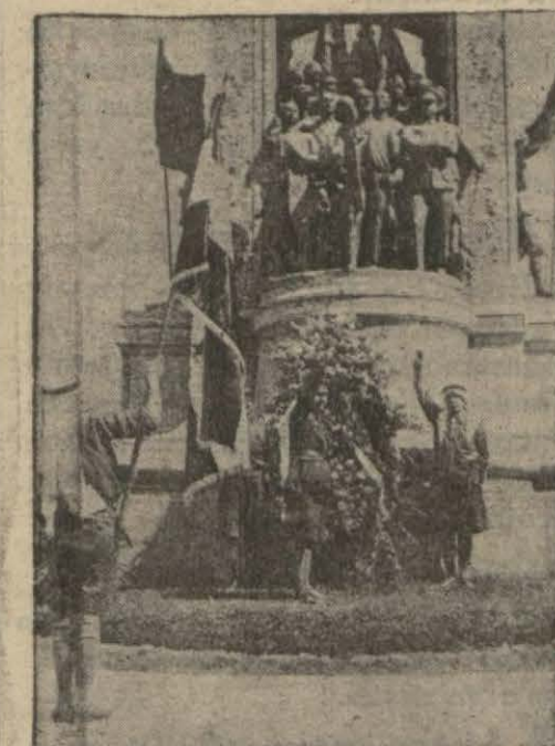
Şehrimizde bulunan Suriyeli izciler dün şehri dolmuşlar ve Taksim abidesine çelenk koymuşlardır.