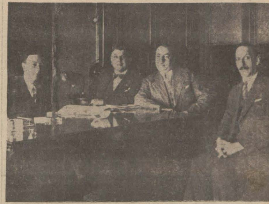
Dün Defterdarlıkta ilk içtimainı yapan komisyon

nz Avrupa ve Amerika değil, bütün dünya Zaro ağayı dünyanın en yaşlı adamı olarak tanıyor. Yalnız şu var ki, Zaro ağadan onu Amerika ve Avrupa ya götürenler ancak şahsî istifadelerini düşünmüşlerdir, halbuki Zaro ağa gibi insanlar artık memleket malıdır. Burada Zaro ağa namına hususî bir sigara imal edildiği sırada, onun yaşını küçültmek isteyenlerin küçüldükleri burada hayretle kaydedilmelidir.