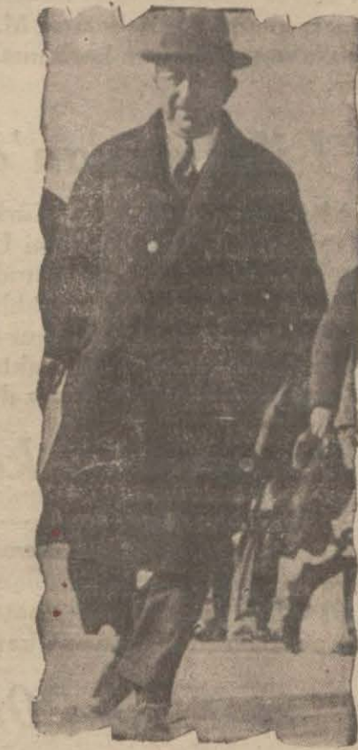
Dahiliye Vekili Şükrü Kaya B.

Dahiliye Vekili Şükrü Kaya B. valilere çok mühim bir tamim göndermiştir. Şükrü Kaya B. kaza ve nahiyelerde devlet