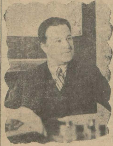
Ziraat Vekili Muhtıs B.

Bu beyanati müteakip kanunun heyeti umumiyesi üzerinde kâfi görülmüş ve maddelere geçilerek kanun kabul edilmiştir. Buna nazaran buğday fiyatını korumak ve tanzim etmek maksadile hükümet lüzum gördüğü takdirde müstahsilin satış arzedeceği buğdayı tesbit edeceği fiyatla Ziraat Bankası vasıtasile alıp satmağa mezuundur. Buğday alım ve satım muhafaza tarz ve şartlarile alım ve satım mahalleri ve buna müteferri diğer bazı hususta icra ve killeri heyeti kararile tanzim ve tayin olunacaktır. Mübayaaya edilecek buğdayların elden çıkarılarak tasfiyesi neticesinde tahassül edecek olan kar silo, ve depo inşasına tahsis olunacaktır. Eğer zarar vaki olursa bu zarar hükümetçe tesviye olunur. Buğday mübayaası için Ziraat Bankasınca açılacak kredinin miktarı ve buna hesap edilecek faizin nisbeti icra vekilleri heyetile banka arasında kararlaştırılacaktır. Ziraat Bankası pazar yerlerinde alacağı buğday bedellerini peşin olarak satış hiplerine tesviye edecektir.