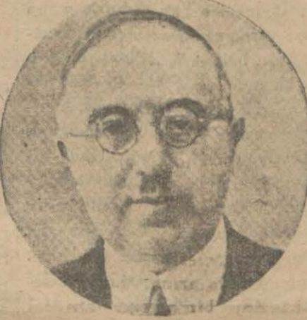
Rahmi Bey İzmir.

Bu rakamlar karşılaştırıldıkta açıkça görülür ki ekilen dönüm ve bilhassa alınan mahsul noksanından bir seneden diğer seneye mühim farklar vardır. Bu farklar iklim şartlarının seneden seneye çok değişiklikler göstermesinden ve ziraat usulümüzün bu değişikliklerden müteessir olmayacak tarzda ıslah ve tekemmül ettirilmiş olmasındandır. Senelik buğday mahsulleri arasındaki nisbetsizlik neticesinde meclletimiz altı senelik kısa bir zaman zarfında haricet mühim miktarda buğday getirecektir.