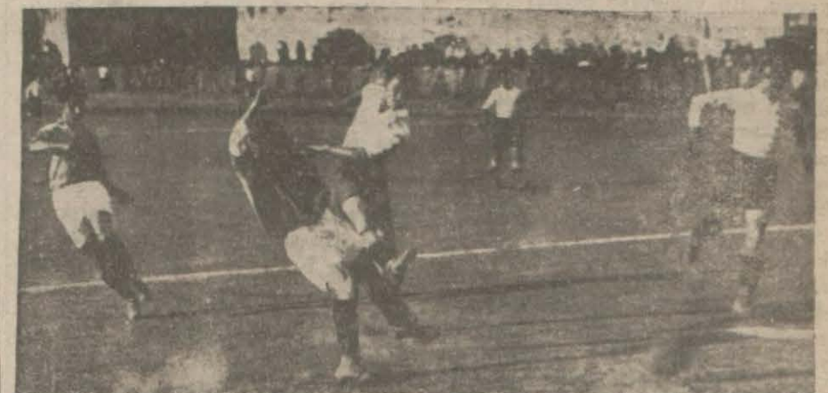
Fransızlar ikinci golü yaparlarken..

ANKARA 3 — Dahiliye vekili Şükrü Kaya bey yarın Bolu ve Adapazarı üzerinden otomobil ile İstanbul'a gidecektir. Şükrü Kaya bey bir ay mezu niyet almıştır. Mezuniyetini Ya-lovada geçirecektir.