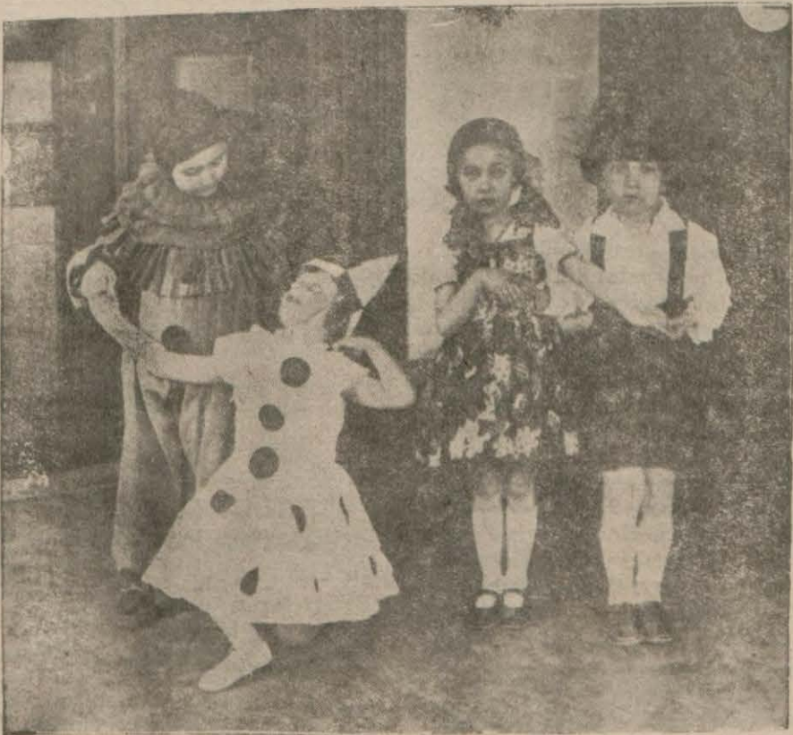
Halk evinde çocuklar müsamesinde..

Dün bir çok yerlerde ve bilhassa Halkevinde müsamereler verildi