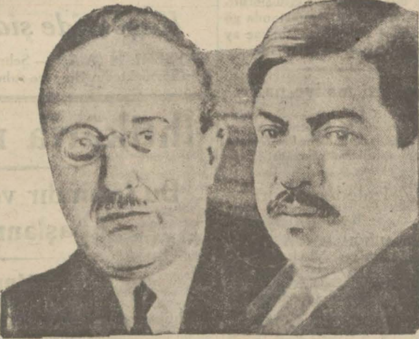
Başvekâlet ve Hariciye nazırlığını deruhte eden M. Laval ve yeni kabineye girenlerden M. Tardieu

Bulgarların tamirat bedellerini vermemek hususundaki kararları Romanyada olduğu kadar Yunanistanda da heyecan uyandırdı