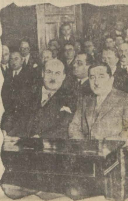
Vali Bey odada.

Meşrutiyetin ilanından iki sene sonraya kadar, ziraat işleri de beraber olarak çalışan Odamız, 326 tarihinde yalnız Ticaret ve Sanayi işleriyle iştigal etmek üzere yeni bir safhaya girmiş ve eski mesaisinden bir dereceye kadar daha muntazam faaliyetimize müvaffak olmuşuz. Milli Hükümetimizin teşekkülü ve Cümhuriyetimizin teassüsünden sonra yeni kanun ve nizamlarla muassır usul ve vazifelerin icabı dairesinde kanunî salâhiyetleri iktisap ve ihraz eden memleketin bu en kıdemli Odası, ticaret ve sanayinin en mühim olan İstanbulda teşkilâtını tevsi ederek ticaret ve sanayi erbabının mesleklerinde inkişafına ve dolayısıyla memleket iktisadiyatında haiz olduğu mevkiî elde etmeye gayret eylemiştir. Bu vazifenin ehemmiyetini müdrik olarak çalışan Odamız, imkânın müsaadesi nisbetinde, müvaffak olduğumuz