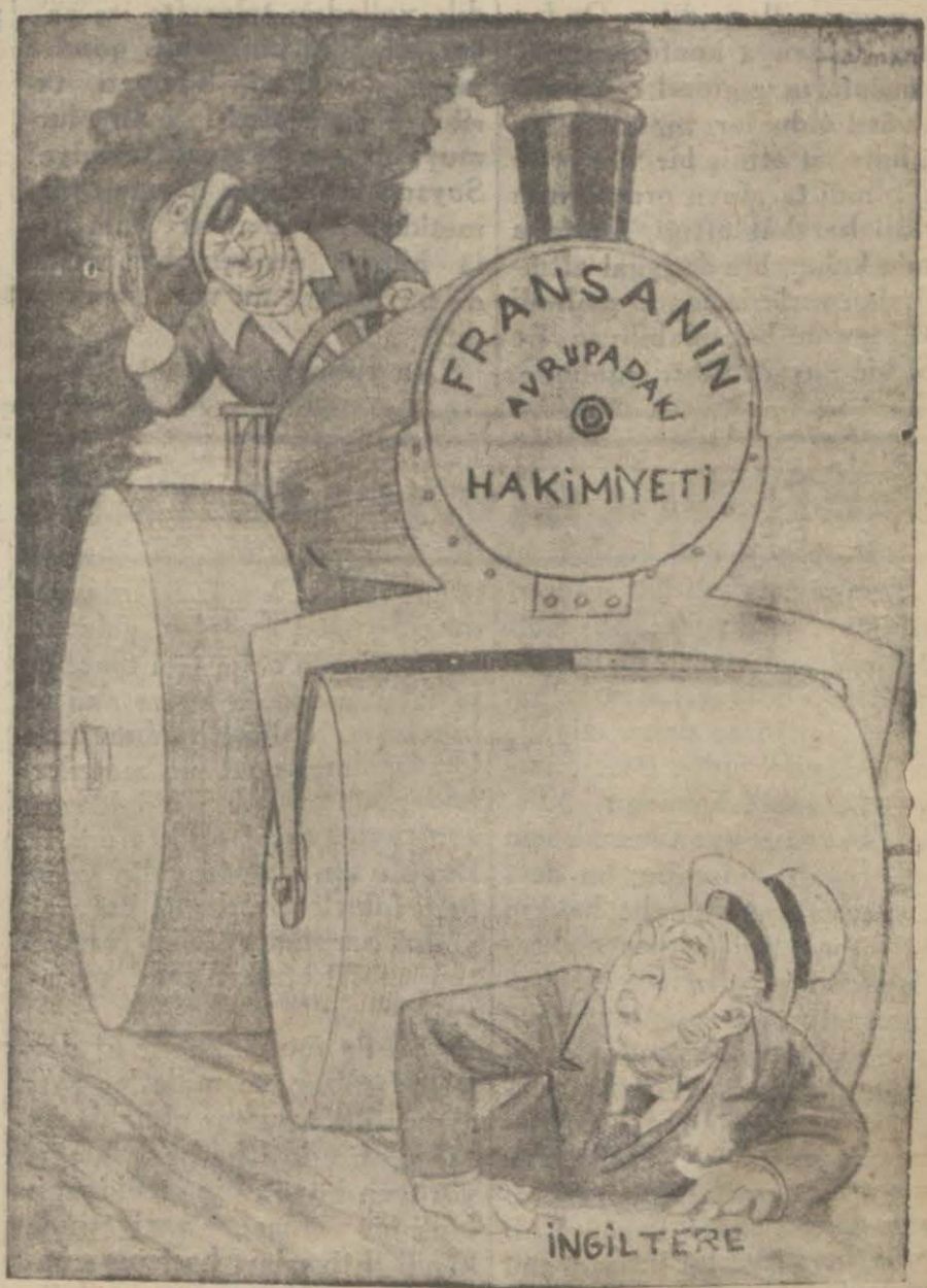
Fransa — Makineyi beraber yaptık. Fakat öyle mükemmel oldu ki evvelâ senin üzerinde tecrübe edeceğiz.