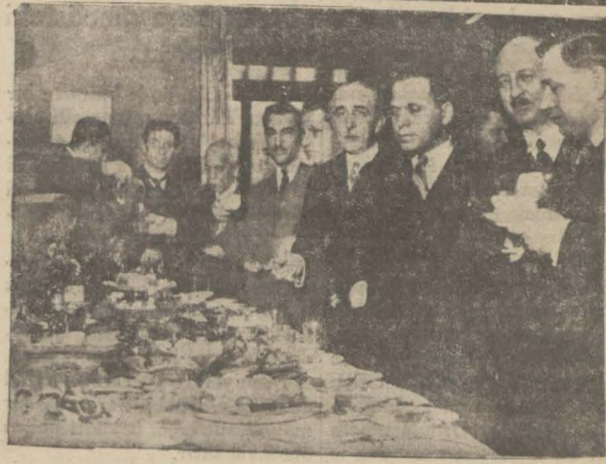
Odada verilen çay ziyafetinde davetliler.