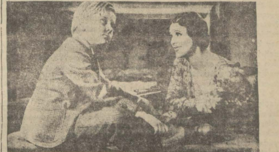
Sinemadaki artist çocuklar arasında büyük muvaffakiyet kazananlardan birisi de Jackie Cooper'dir. Şimdi Avrupa'ya seyahate gelen bu sekiz yaşındaki artist senede bir buçuk milyon franktan az kazanmayor.

"Şen mülâzım", aşağı yukarı bir operet filmidir. Eski üniformaların ihtişamı, eski sarayların bedbaht derecesine varan etiketleri içinde Maurice Chevalier nasıl olduğunu bilmeden, kendisine çılgınca âşık bir prensesle evleniyor. Maurice esmer Claudette Colbert ile sarışın Miriam Hopkins arasında hayli tereddüt geçiriyor. Bir sarışına, bir esmere gidiyor ve en nihayet bir noktada karar kı lıyor.