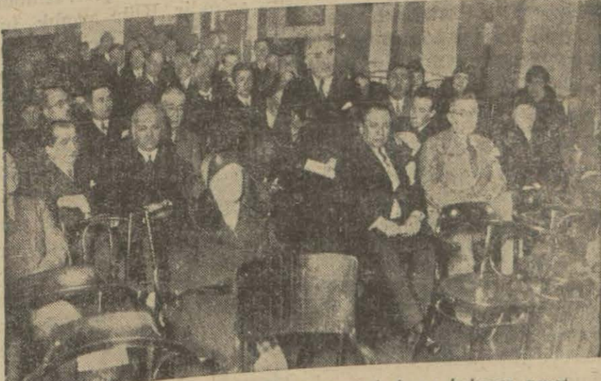
Veremle mücadele cemiyetinin kongresinde hazır bulunan zevat

Cemiyetin Anadolu'da şubeler açmasına, merkezin Ankaraya nakline karar verildi