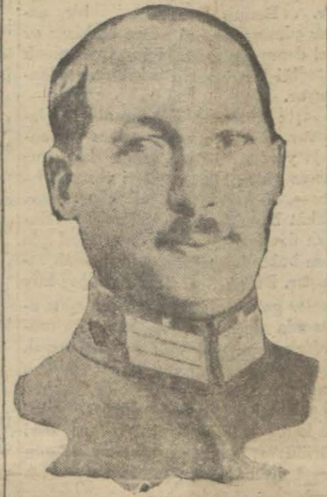
Erzurum ko.ordusu kumandanı Salih Paşa

Erzurum, 20 (Milliyet) —En büyük servetimizi teşkil eden hayvanatı ehliyemizin cinslerinin ıslah ve teksirine çalışmak hayvan sergileri ile at yarışları nın fennî bir şekilde yapılmasını temin eylemek gayesiyle dört sene evvel şehrimizde teşekkül eden sipahi ocağı şimdiye kadar esaslı bir faaliyet ve mevzu diyet göstermediği için kolordu kumandanı Salih Paşanın ihbar ettiği arzu üzerine belediye dairesi salonunda vali Fevzi B. in riyasetinde bir kongre akdedilmiştir. Kongrede Salih ve Sabri Paşalar ile sair ümerayı askeriyeye ve esrafi belde ha-