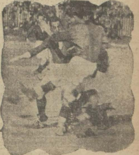
Fener - Galatasaray maçında bir enstantane

İkinci devre başladığı vakit, gene Vefahar hücumla geçtiler. Fakat bir oyunun bütün nümunelerini görüyor