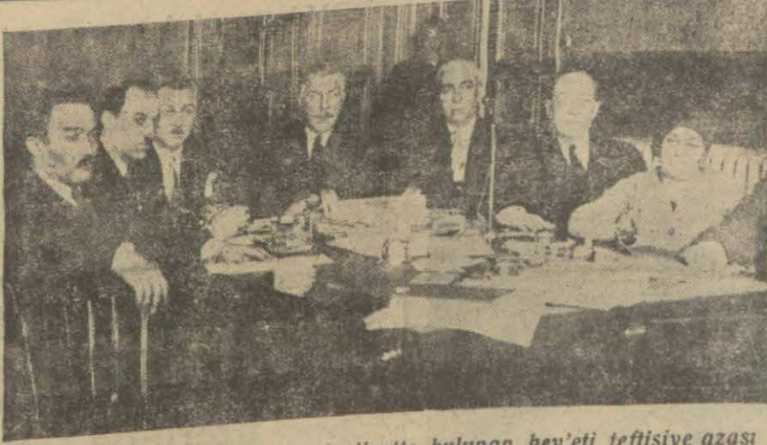
Dün cuma olmasına rağmen faaliyette bulunan hey'eti teftişye azası