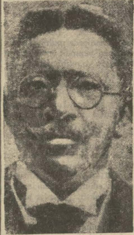
Liberya cümhur reisi King