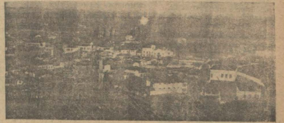
Edremitten bir manzara

Mahsul oldu. Şu sene (16) milyon okka zeytin ve 4 milyon okka yağ çıkarılıyor. Bodur ağaç yetiştirmek için ne yapmalı?