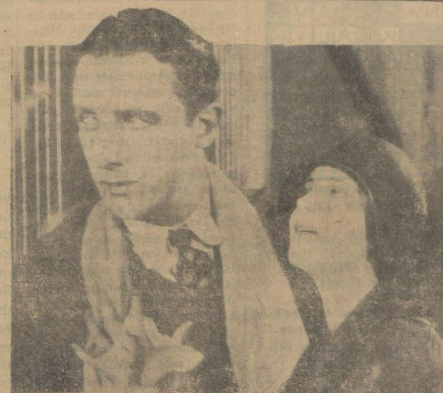
"Kadınlara inanmam,, filminden

Bundan evvel de yazdığımız veçhile gelecek mevsimde Beyoğlunda yeni sinema salonları açılacaktır. Bunlardan birisi şimdiki «Lüksemburg,, sinemasının yerine yapılacak olan 1800 kişilik salondur. Bu salonun ismi «Gloria,, olacaktır. A melivata bu hafta başlanacaktır.