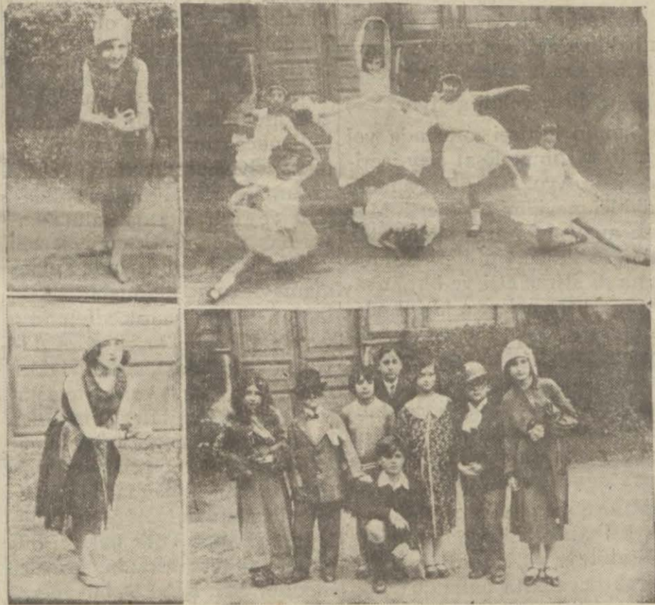
Dün Tepebaşında verilen mülâmeden intibalar

ATINA, 24 (Anek.) — Dün Türkiye sefiri Enis B. Yunan Hariciye Nazirile uzun bir mülakatta bulunmuş, Türkiye'nin son teklifleri hakkında talep edilen izahatı vermiştir. Bu mülakatta umumî meselelerden başka teferruata da temas edilmiştir. Görüşülen meseleler hakkında ketumiyet muhafaza edilmekle beraber Türkiye mübadil emlakın umumî takas ve mahsubuna taraftardır. Bu teklif mucibince mübadil emlakın tasfiyesi meselesinin bitaraf azaya tevdi edileceğinden bahis olan beşinci maddede itilafnamenin tayıyolunacaktır. Mübadil emlakın tasfiyesi hakkındaki türk teklifine Yunan Hariciye Naziri cevap vermek hakkını muhafaza etmiş ve Yunan sefirinden gelecek malûmata intizar edeceğini de söylemiştir.