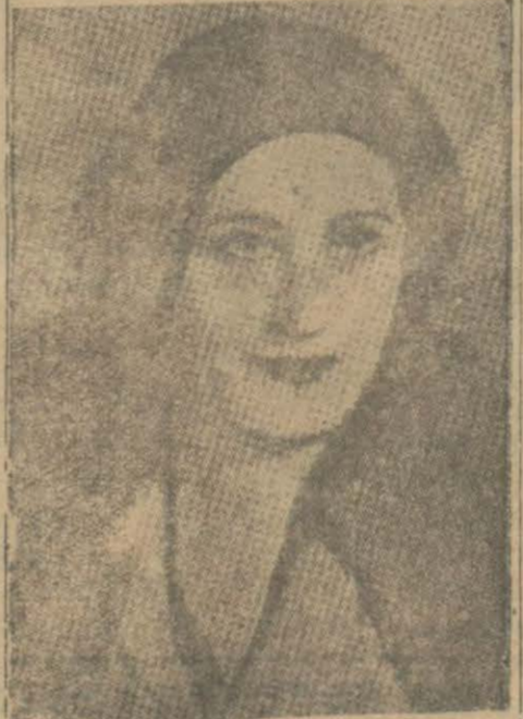
M. Mussolininin kızı

ROMA, 24 A.A. — M. Mussolininin büyük kız bugün muameleyin arkadaşlarından amiral Cianonun oğlu ile evlenmektedir.