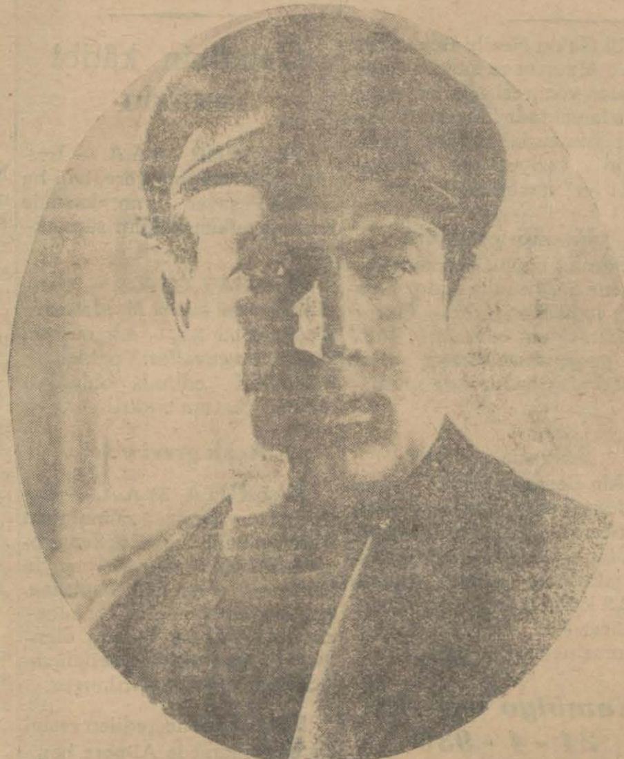
"Kadınlara inanmam,, filminden

Rakibi ile metresinin ihaneti yüzünden mahvolmak üzere olan Saccard isimdeki banker Jak Hamlin isminde bir tayarrecinin bulduğu bir karbiüran işi ile vaziyetini kurtarır fakat tayarrecinin bir bahrimuht seyahati esnasında karısına musallat olur. Kadın herifi öldürmek ister. Nihayet Saccardın eski metresinin tesirile hem piyasadaki mevkiini kaybeder hem de bütün yaptıkları için hapse girer. Tayarreci de avdet ettiği zaman bir malî dalevera töhmetle tutulursa da be-raet eder ve karısıyla mes'ut olur.