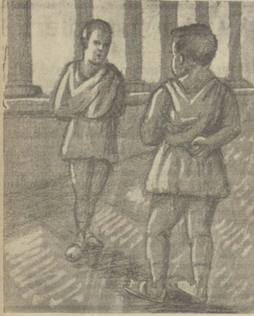
Neron — Merhaba Britaniküs... Britanikus — Merhaba Ahcnobarbus!..