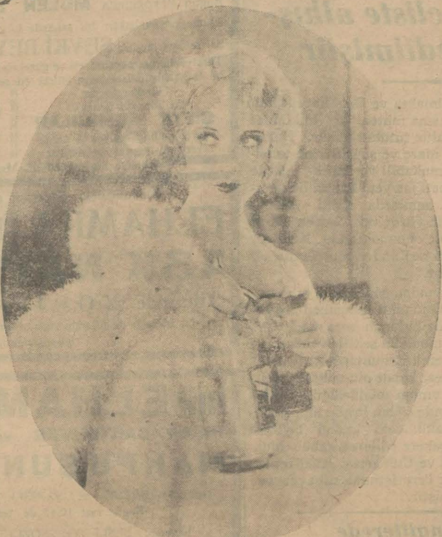
"Mahbusun şarkısı,, filminden