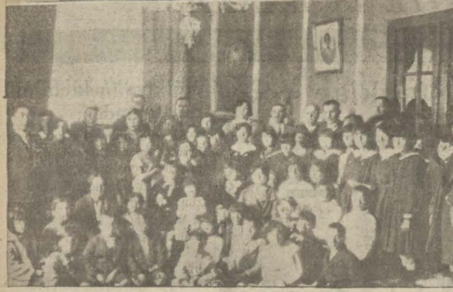
23 Nisan çocuk bayramı Ankara'da büyük ve muvaffakiyetli bir şekilde tes'it edilmiştir. Daha erkenden bayramlarını tebrik için toplanan küçükler akşamlara kadar şeye ve sevinç içinde bir gün geçirmişlerdir. Resimlerimiz misal mialleri B. M. M. Reisî KAZIM, Başvekil İsmet paşaların ziyaretleri intihabını ve yeni kışat edilen Türkocağı salonu ile davetlileri ve bu münasebetle nutuk irat eden Hamdullah Suphi Beyi göstermektedir.