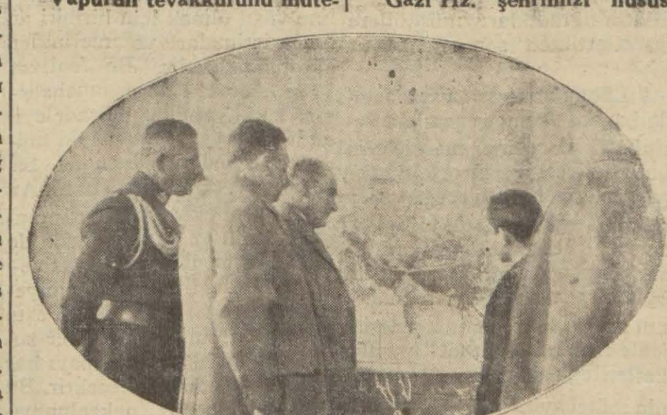
Gazi Hz. haritada, tebeşirle çizdikleri hutut içindeki yerlerin, Türklerin gelmiş olduğu anıyurt olduğunu Samsunda bir türk çocuğuna anlatıyorlar

Gazi Hz. çok beşuş Gazi Hz. saraya çıkarken Devami beşinci sahifede.