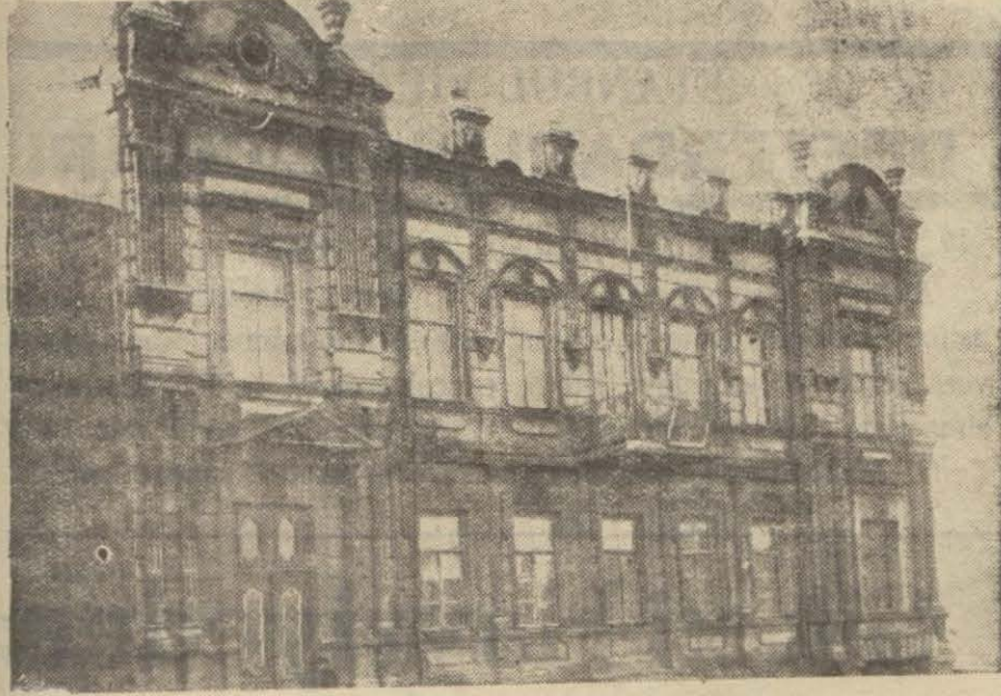
Kars Memleket Hastanesi

Başarılacak işleri yalnız fertlerin teşebbüslerine bırakmakla hata ediyoruz..