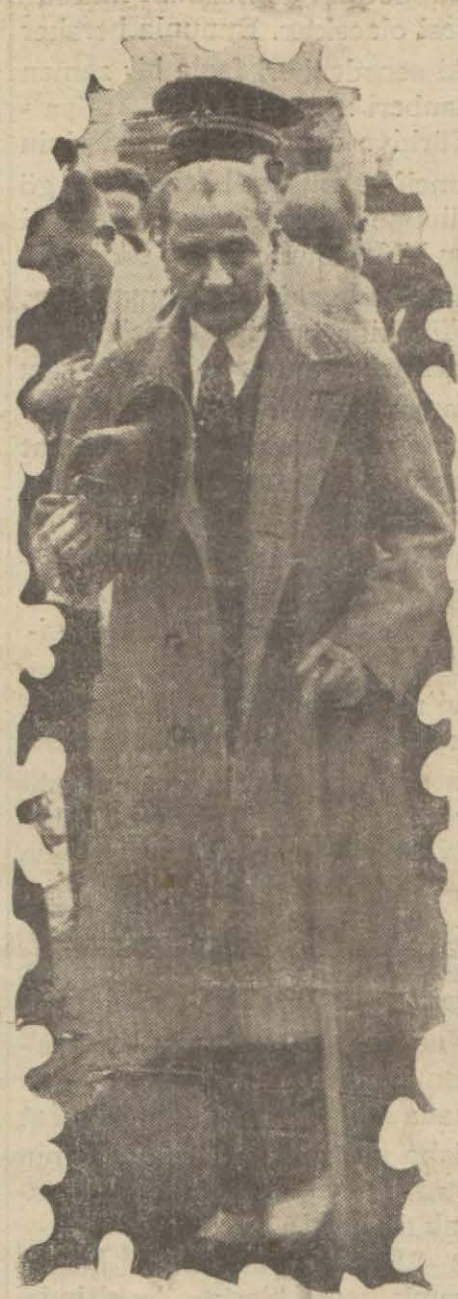
Müncimiz saraya giriyorlar