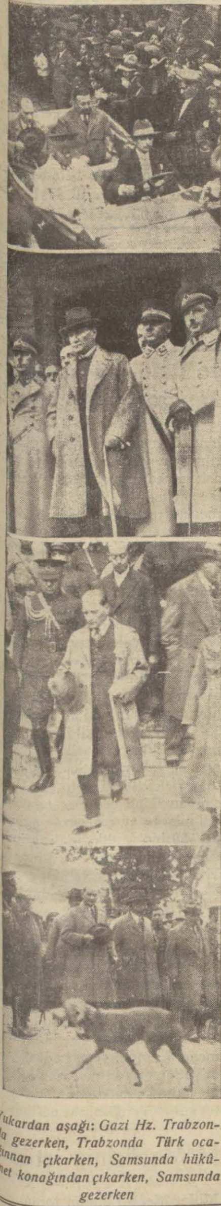
Yükardan aşağı: Gazi Hz. Trabzon'da gezerken, Trabzonda Türk ocaklarının çıkarken, Samsunda hükümet konağında çıkarken, Samsunda gezerken

İki yunan truğu ile Darülbeytiyi artistleri bir arada Dün Gardenbarda, Darülbeyti bir surette eğlenmiştir. Davet dayı tarafından, Yunan artistleri şerefine bir çay ziyafeti verilmiş, uzun bir müddet samimi B. de bulunmuştur.