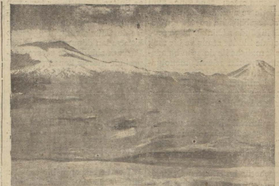
Türk hudutları dahiline girecek olan muhayyel kürdistanın mezarı Ağrı