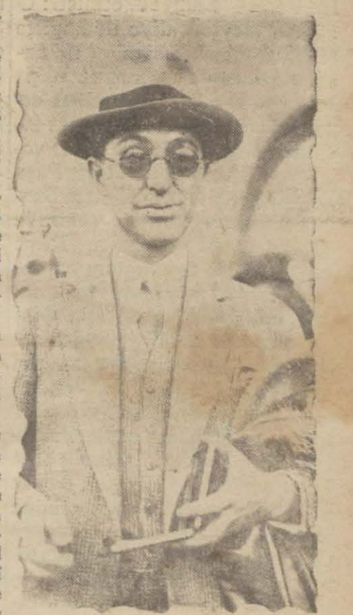
Hariciye vekili Tevfik Rüşti Bey

"— Hariçte bir müderris faaliyette bulunabilmek için fakülte meclisinden mezuniyet isteyecektir. Fakülte meclisi de bu faaliyetin Darülfünun mesa isine ve laboratuvar, enstitü gibi bin manzım mesaiye mâni olup olmadığını tetkik edecek ve sü lüsanı ekseriyetle karar verecektir. Bu vaziyette divan azasının muhakkak çok meşgul müderrislerden olacağı hakkında da bir kayıt olamayacaktır. Müderrislerin hariçte alacakları ve