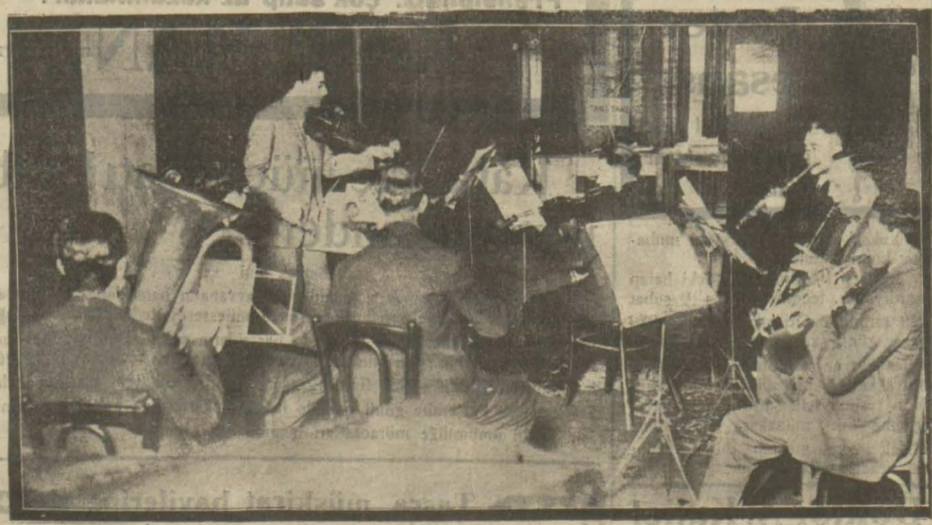
Radyo şirketinin alafranga saz hey'eti