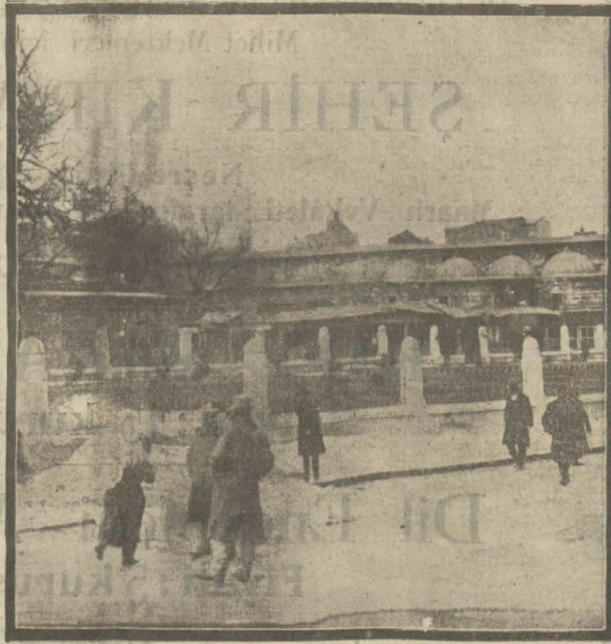
Evelce geçilmez bir halde olan Yenicami parkının şimdiki hali.