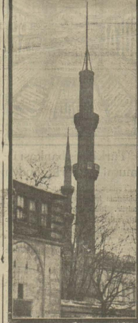
Tamir edilen Sultan Ahmet camii minarelerinden biri

Ankara postası filmi bitmek üzeredir. Resim heyecanlı iki sahneyi göstermektedir.