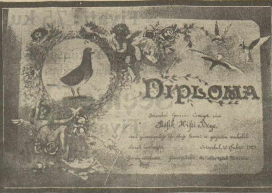
Türkiyede ilk defa olarak verilen bir güvercin şahadetnamesi.