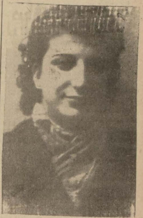
(Yazısı 3 nüde mahkemeler sütnumuzda).

Adlede davasından feragat etti Kadın polise hakaret- ten mahkûm oldu