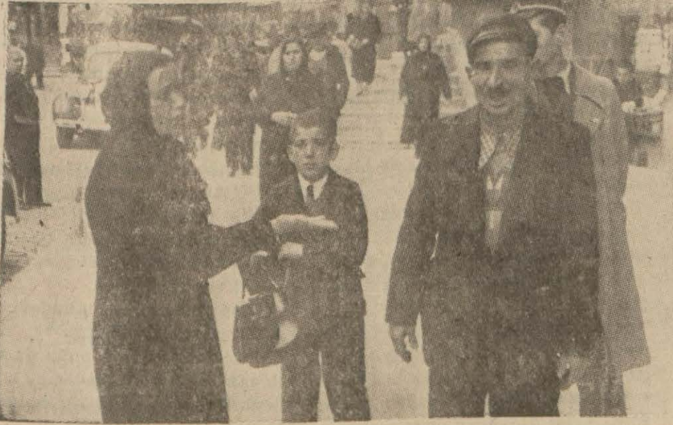
Ayrılan aile ve çocukları.

Ağırceza mahkemesi, dün, entere san bir sahtekârlık duruşmasını karara bağlamıştır. Hâdise şudur: