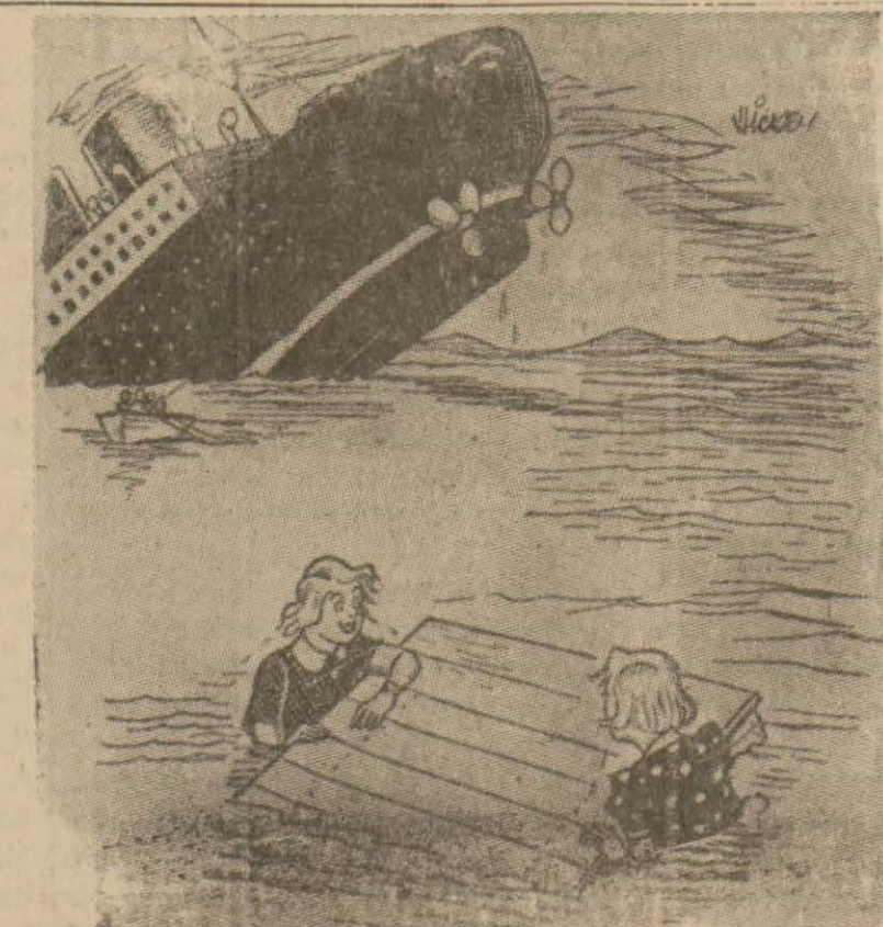
— Efendiciğime söyleyeyim... nerede kalmıştık?

Şüphesiz ki, bunun için, ormanın gayet sık olması ve ağaçları arasında geniş aralıklar bulunmaması lâzımdır. Aksi takdirde sporcu ağaçların arasına yuvarlanarak tehlikeli bir âkıbete sürüklecektir.