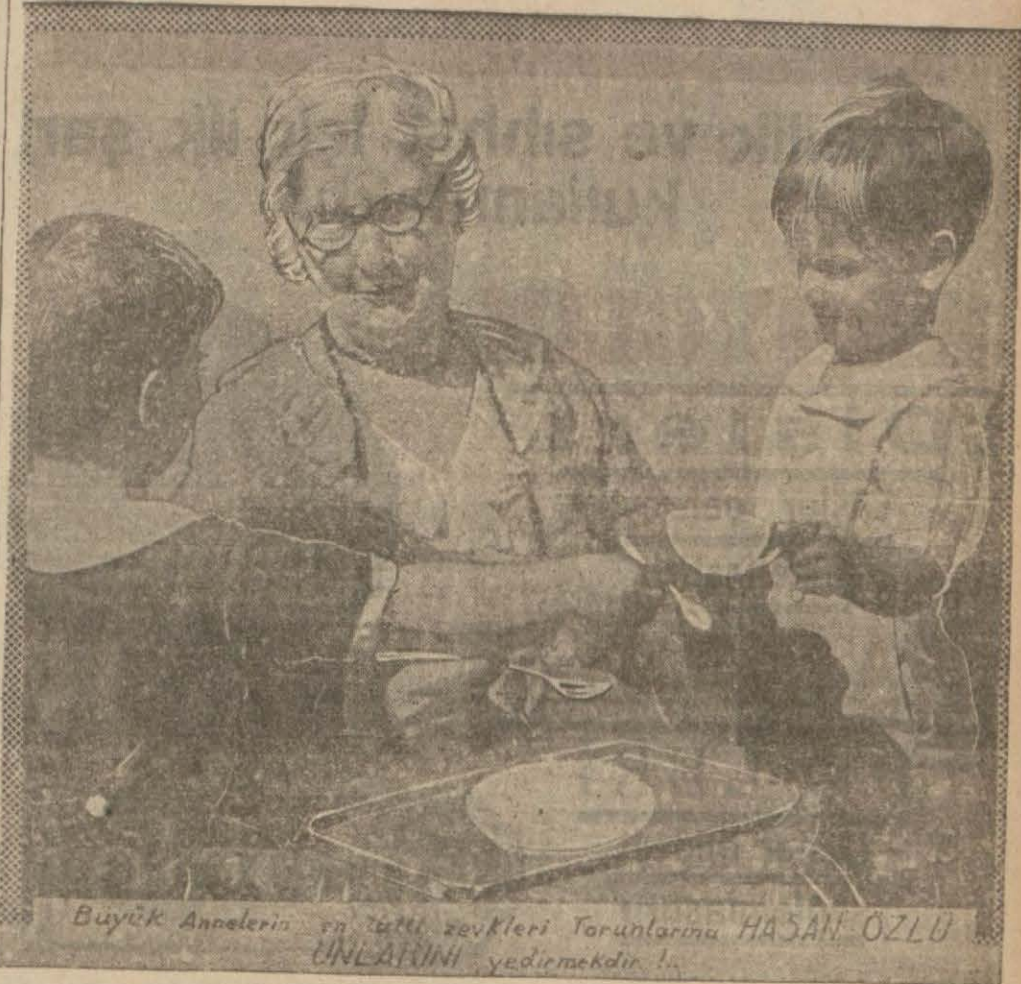
Büyük Annelerin en tabii zevkleri Torunlarına HASAN ÖZLÜ UNLARINI yedirmekdir.

Avrupanın bayat, kurtlu çocuk gıdalarından sakınınız! Yavrularınızın midelerini abur cuburla doldurmayınız ! Tabii saf, lezzetli