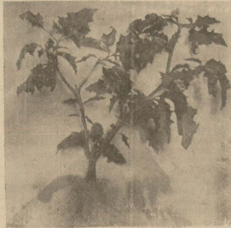
Tababette kullanılan ilâçlardan: Datma.

Cenupta: Bu mntakada garp havalisinin yetiştirdiği nebatlarla, sıcak memleketler nebatlarının bazılarında tesadüf edilmekle beraber bura ikliminin pek müsait olmasından dolayı gerek sinai ve gerekse tıbbi birçok nebatlar vardır ve yetiştirilebilir.