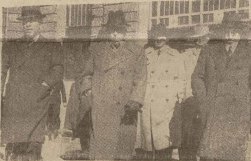
Başvekil Haydarpaşa a istasyonundan çıkarken

Başvekil B. Celâl Bayar dün Ankaradan şehrimize gelmiştir.