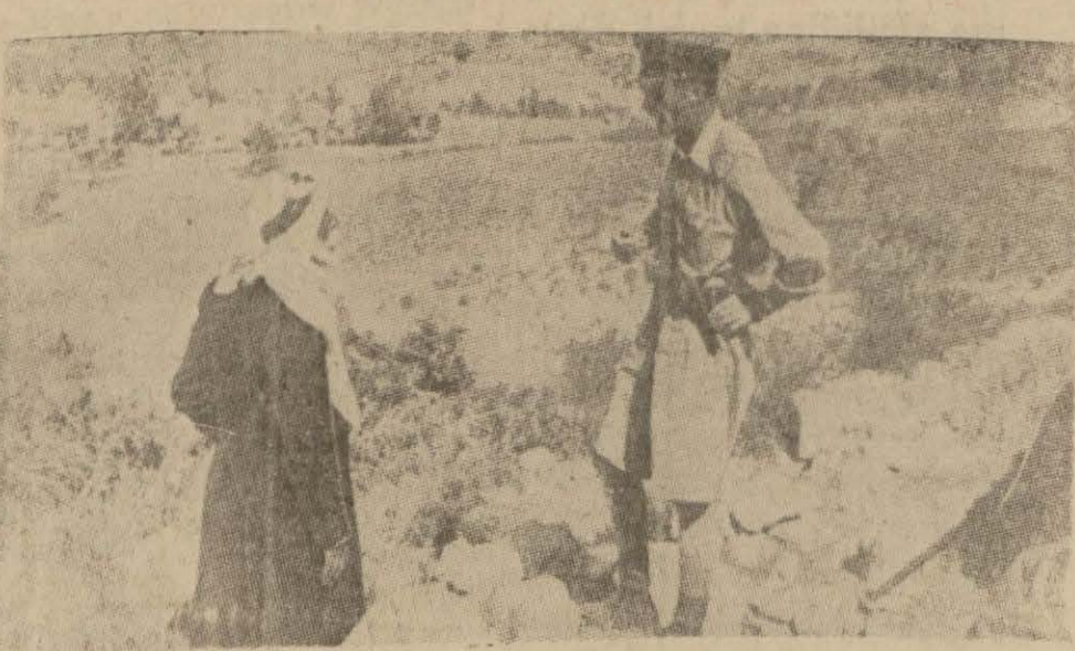
Filistinde bir İngiliz askerî şüpheli gördüğü bir Arabı sorguya çekiyor.

13 mil sürat kâfi değildir, bu sürat 18-20 mil olmak lâzımdır. Tâ ki, gemi zaman ile süratinden bir miktarını kaybettiği ve fırtınalı denizlerde yol almak mecburiyetinde kaldığı takdirde vazifesini kifayet ile yapabilsin.