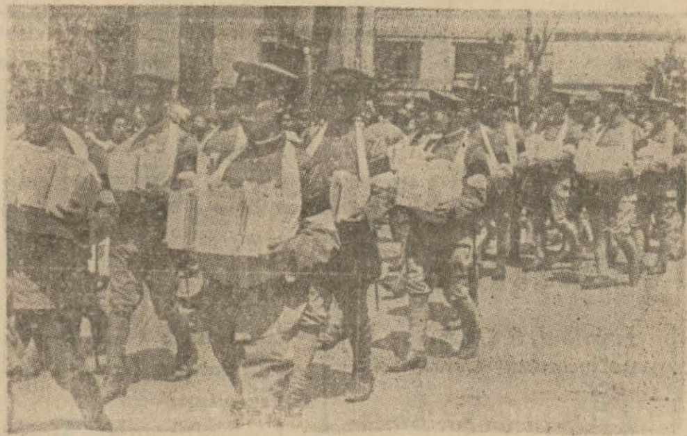
Çin harbinde ölen arkadaşlarının küllerini boyunlarında taşıyarak Tokyo sokaklarından geçen Japon askerleri

Maamafih bu lâubaliyane söze rağmen, Çin topraklarında bugüne kadar devam eden muharebeler Japonya'ya pahalıya mal oldu. Japonlar Çin