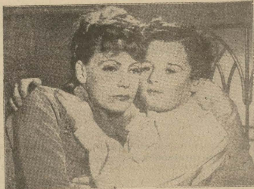
İki sinema yıldızının sabah tuvaleti

Kürkler, parça halinde omuzlara, yakalara, dirseklere, yemlere, öne, arkaya ve eteklere