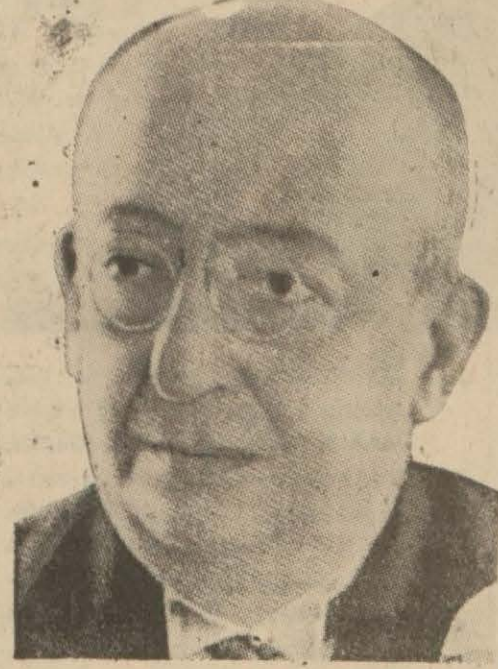
Kongrede nutuk söyleyen Bay Refik Saydam

Kongreyi Sıhhat vekili açtı, Refik Saydam bir nutuk söyledi