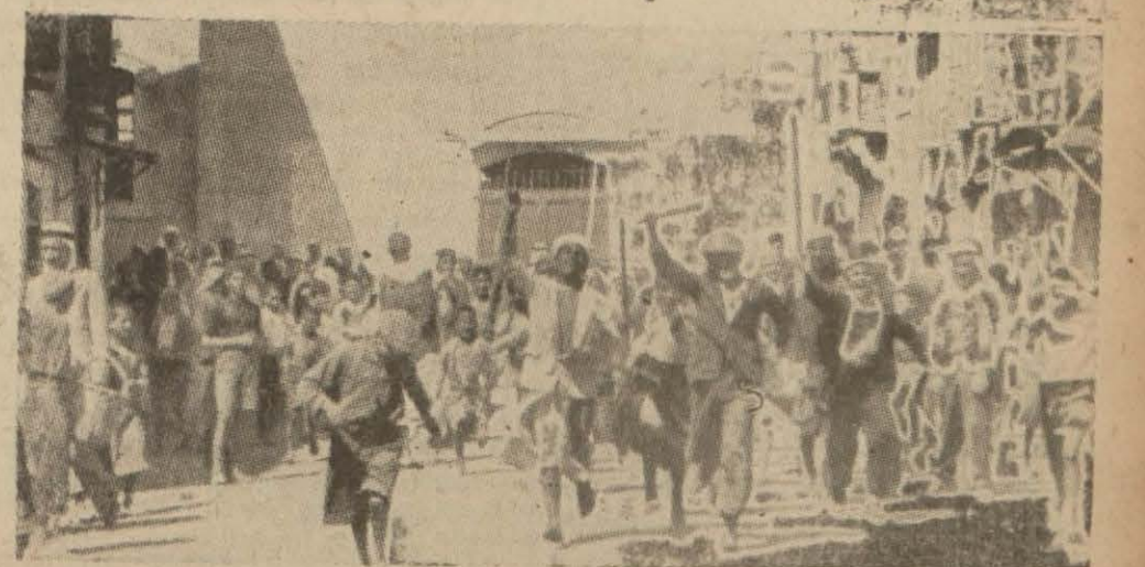
Kudüste Araplar bir nümayiş esnasında

Kudüs, 17 (A.A.) — Filistinde umumî vaziyet gittikçe fenalaşmaktadır. İki İngiliz nakliye vapuru ile Hayfaya yeniden Maltadan ve İskenderiye'den