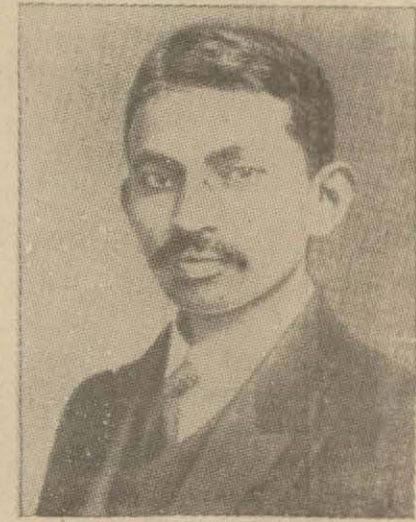
Gandi 1890 senesinde

1893 senesinde bir gün (Gandi o zaman 27 yaşında idi) Hacı Abdullah avukatını, bir iş için