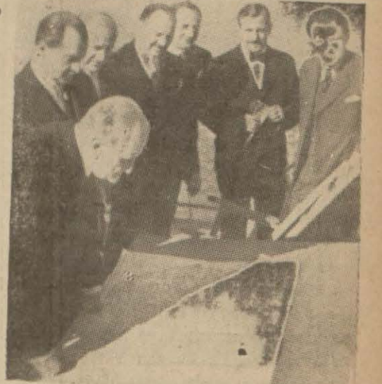
Macar Hariciye Nazırı, harita üzerinde tetkikler yapıyor

Varşova, 17 (A.A.) — Polonya hariciye nazırı Bek, İtalya ve Rumanya